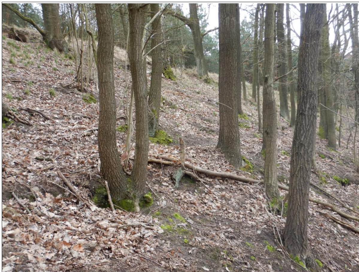
Widok ogólny na osuwisko