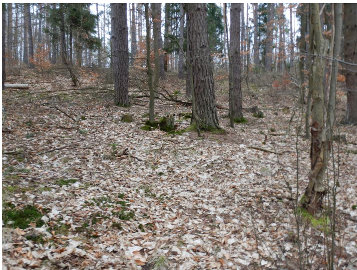
Widok ogólny na osuwisko