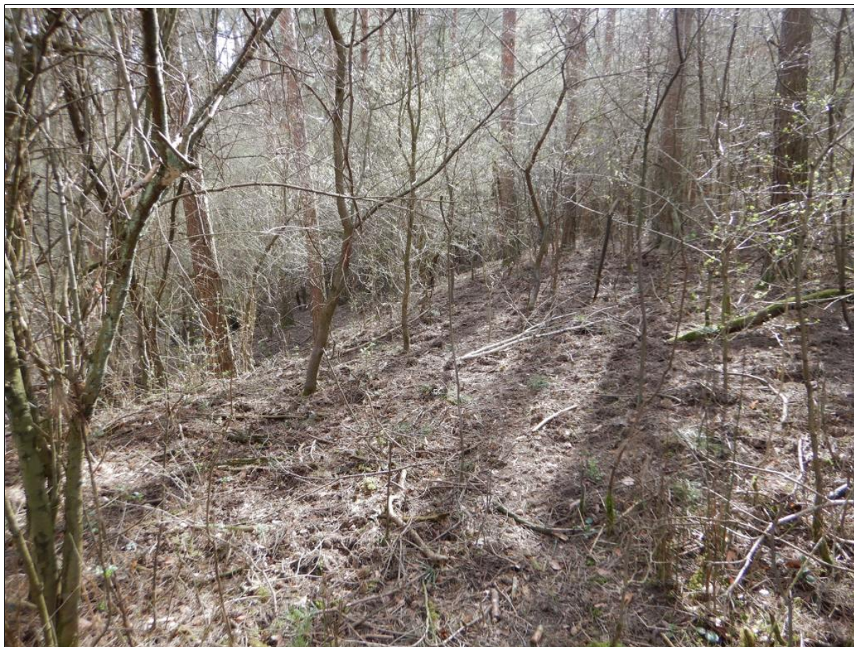
Górna część osuwiska