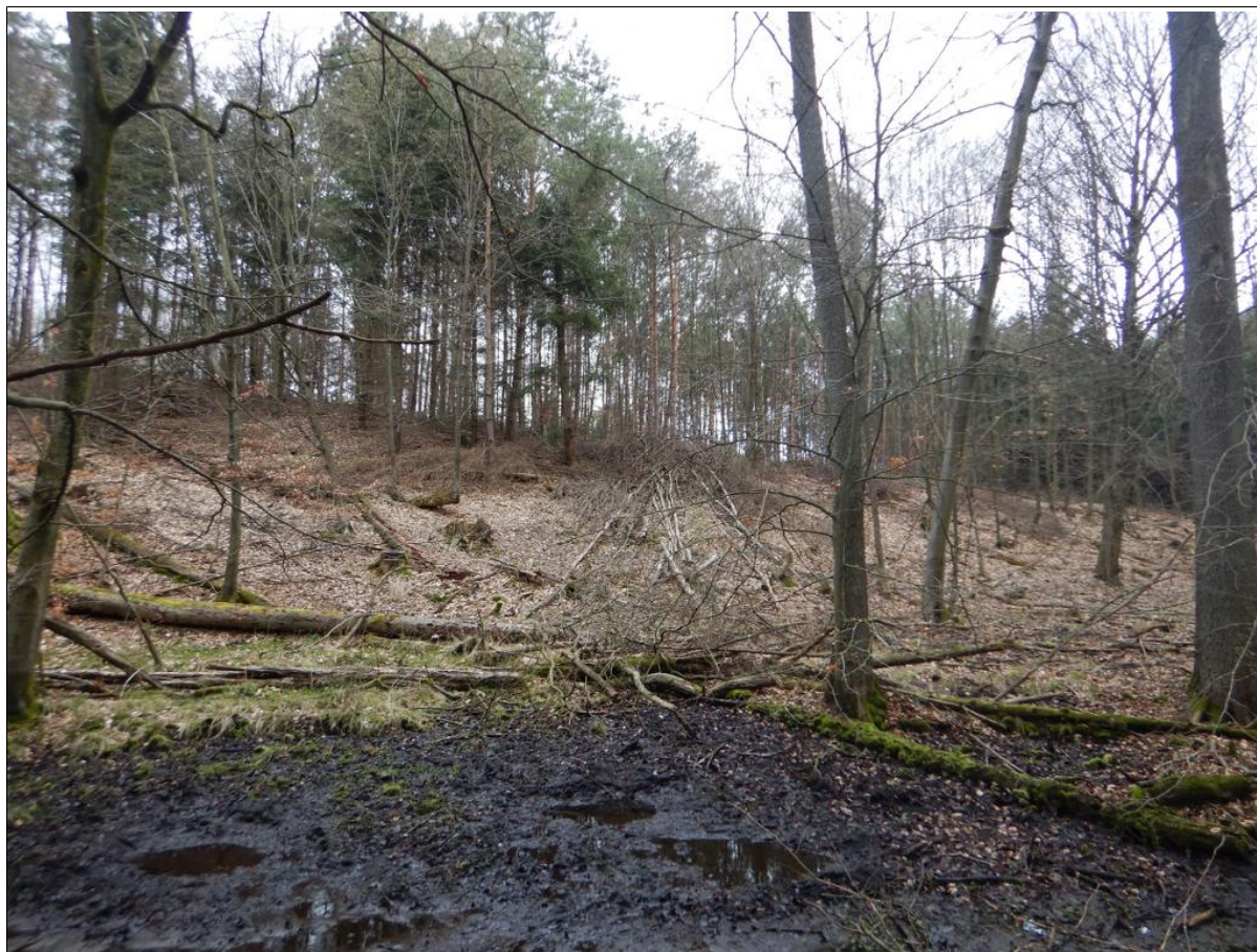
Widok na czoło osuwiska