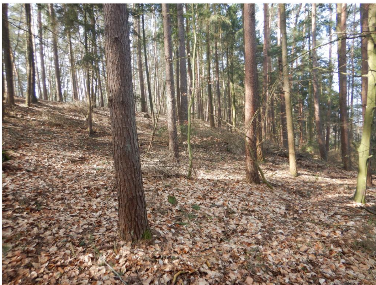
Widok na kuluwium