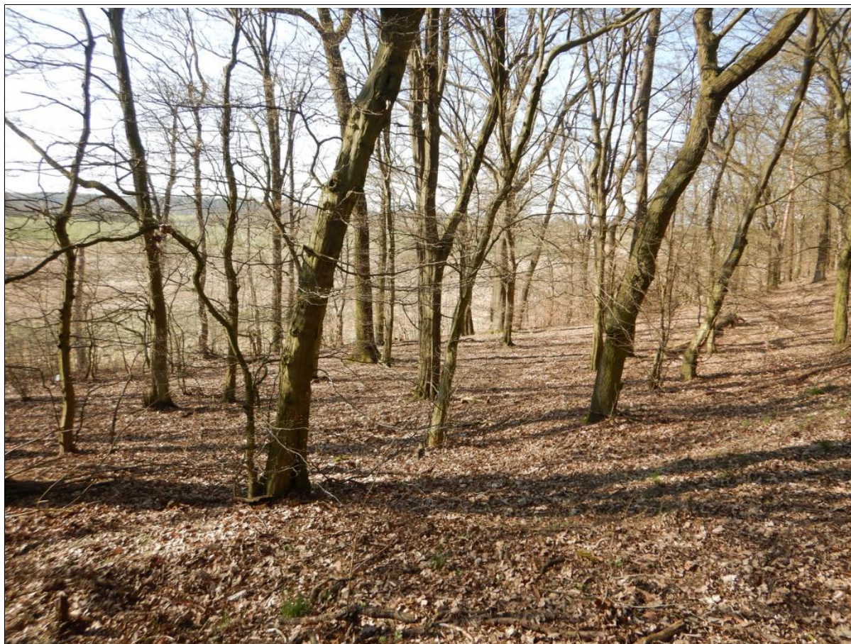
Widok ogólny na osuwisko