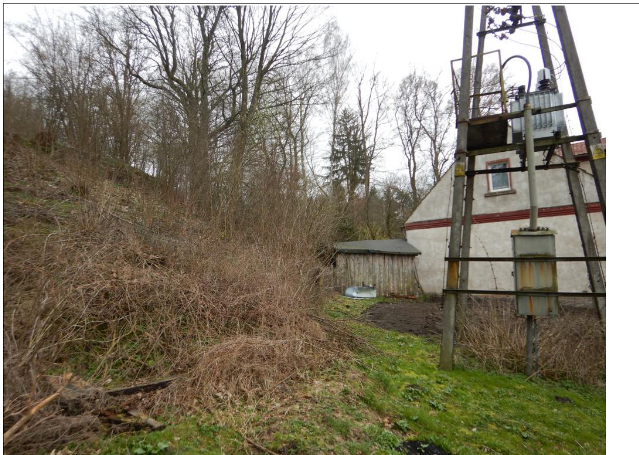
Widok na czoło osuwiska