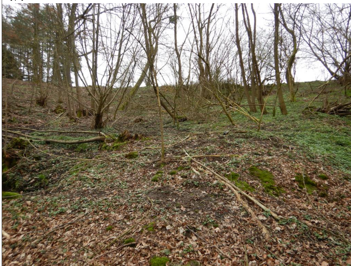
Fragment niewielkiego pagórka koluwanego