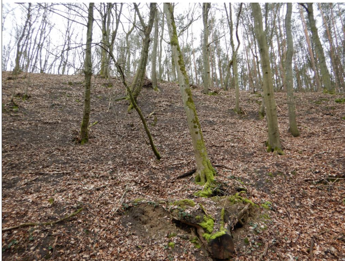
Przechylone drzewa na koluwium