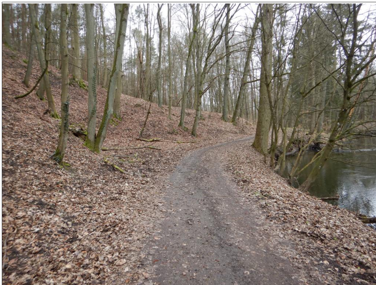
Czoło osuwisk i droga leśna