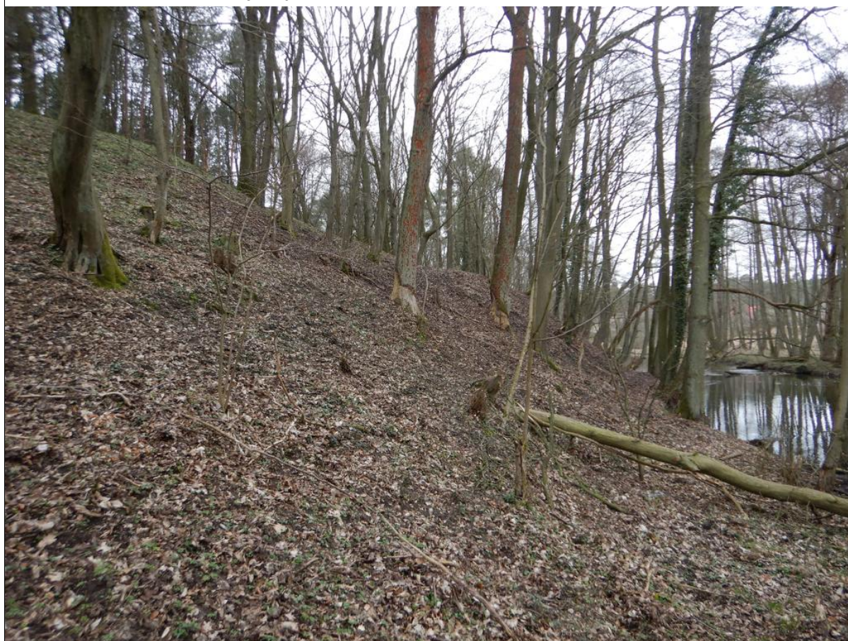
Koluwium z półką