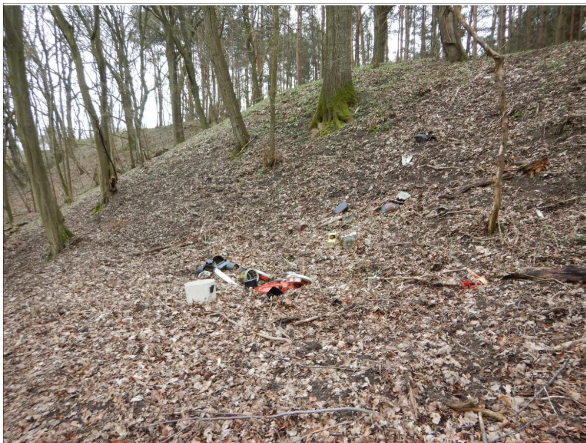
Niwielka półka w północnej części. Śmieci