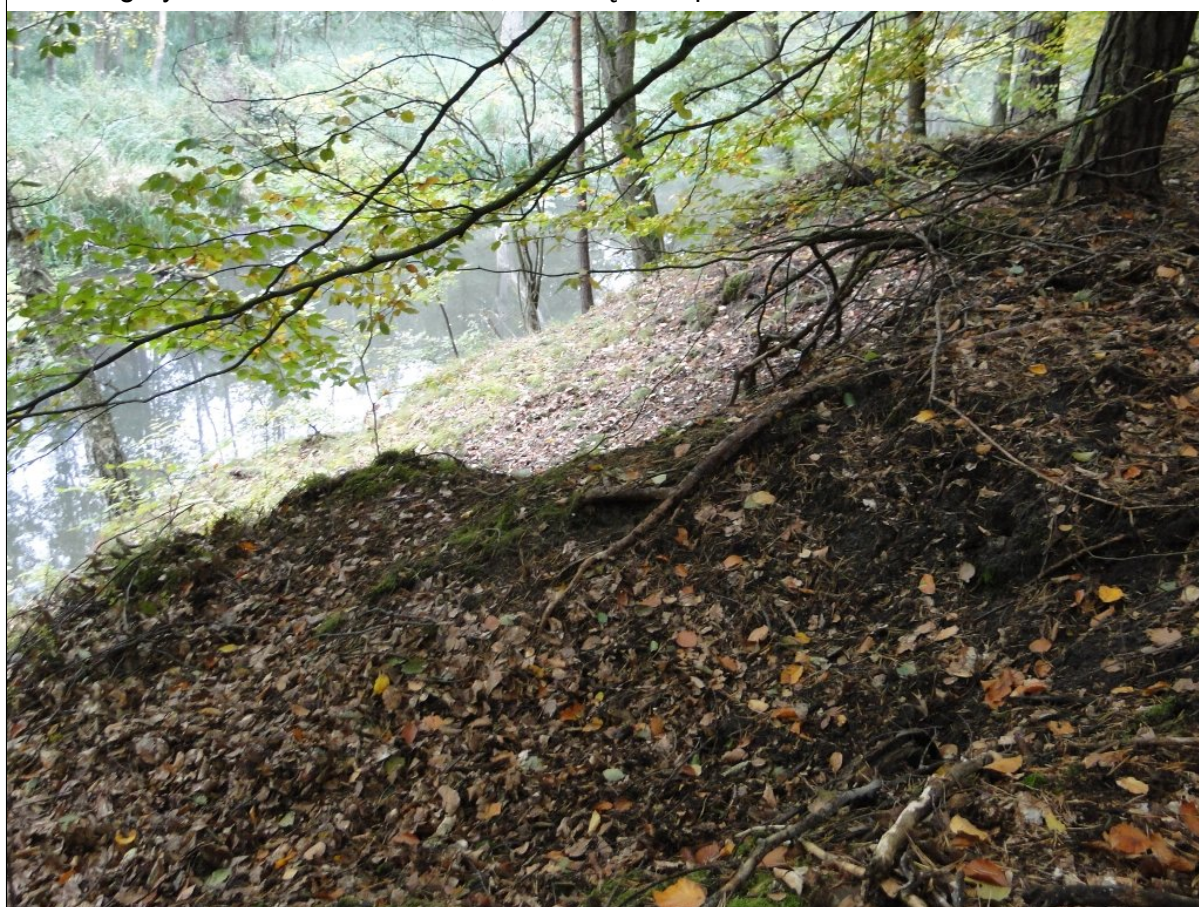
Skarpa główna osuwiska.