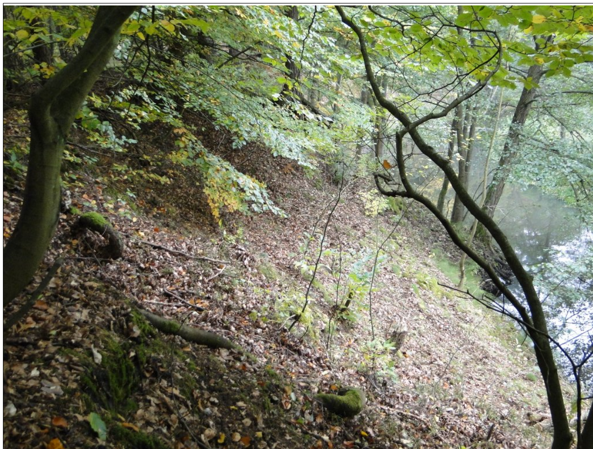
Widok z góry na koluwia osuwiskowe, schodzące do potoku.