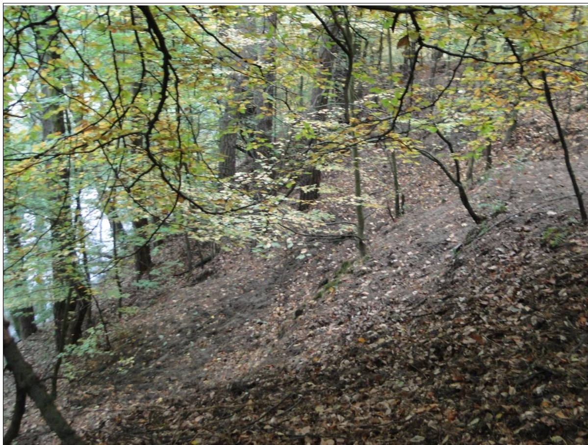
Koluwia osuwiskowe w górnej części.