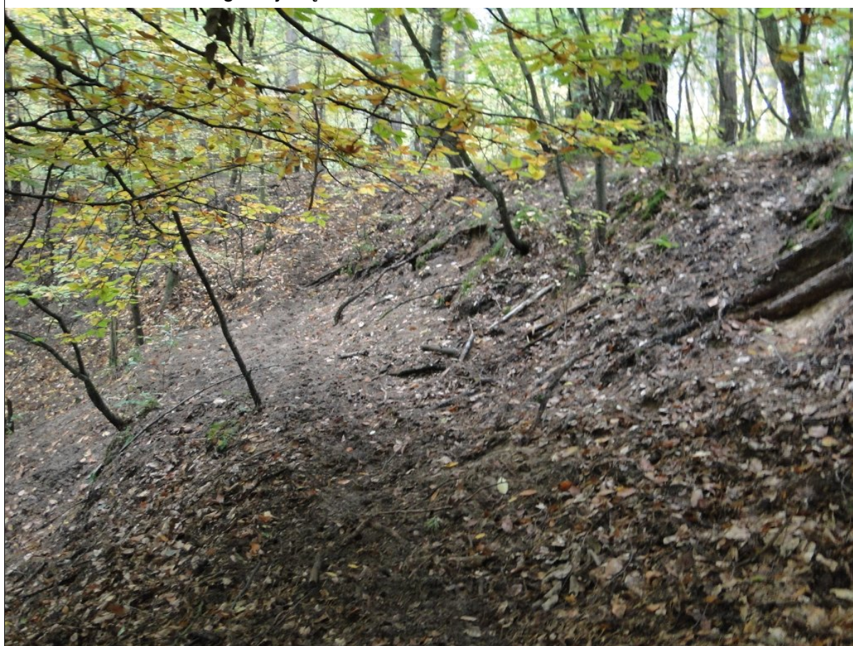
Widok skarpy głównej osuwiska, porośniętej drzewami.