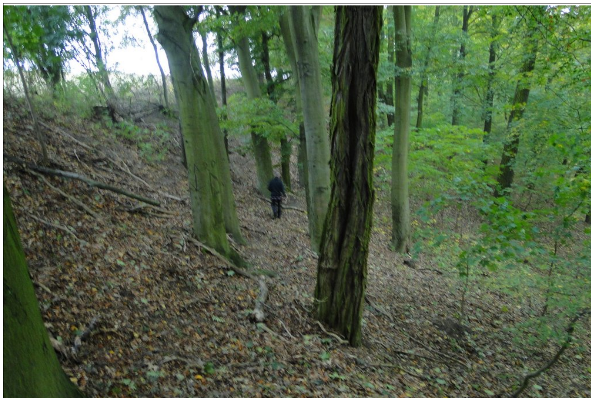
Koluwia i skarpa główna osuwiska.