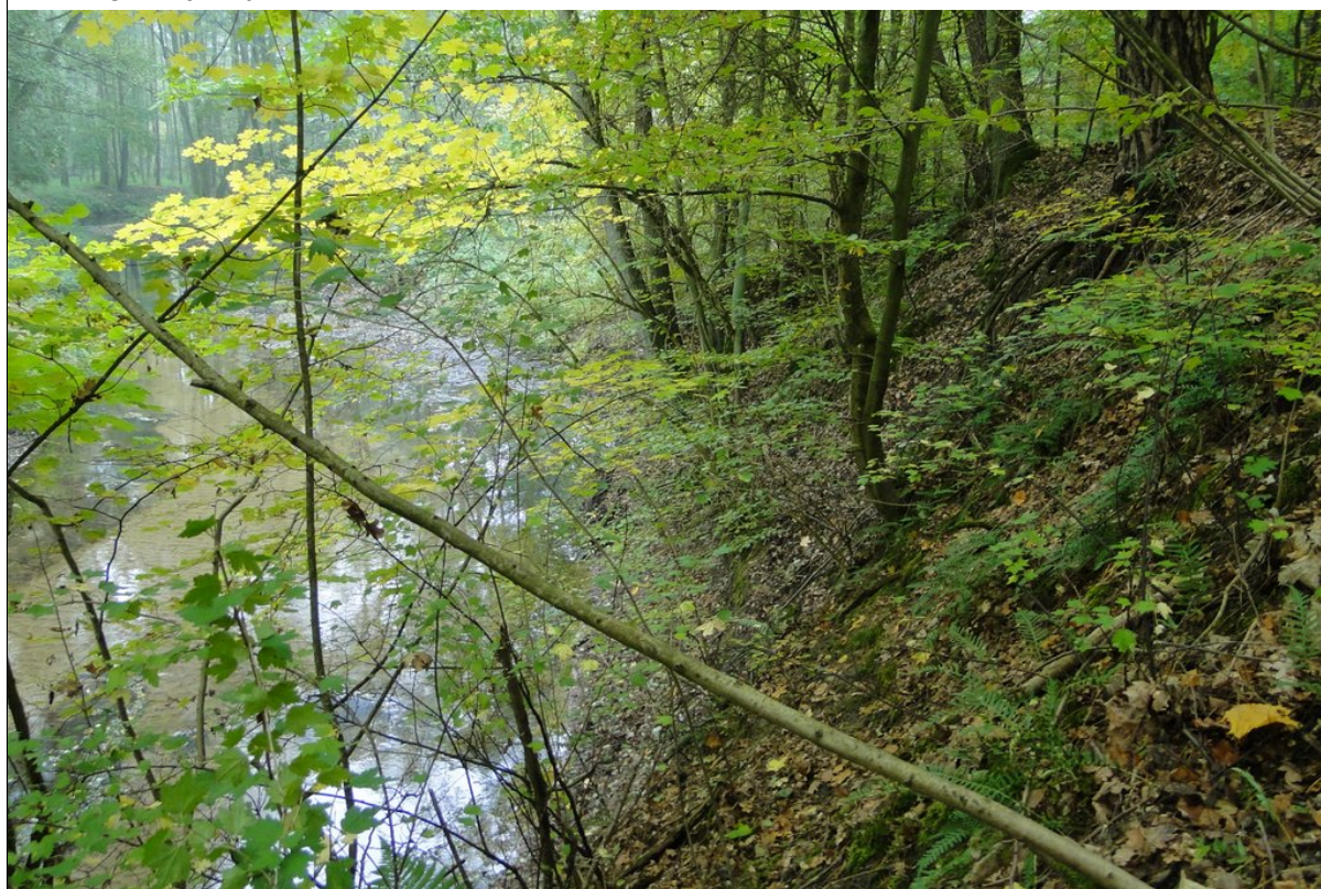
Koluwia osuwiska zachowane na stromym zboczu.