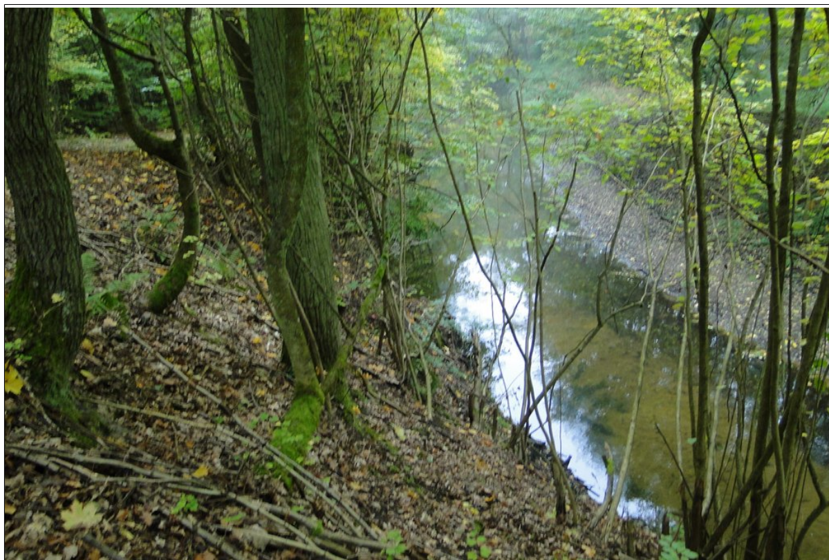
Widok górnej części osuwiska.