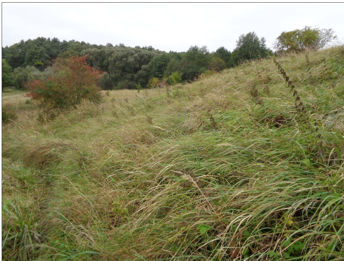
Widok czoła osuwiska.