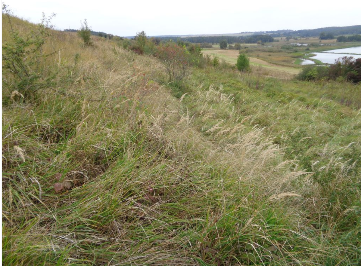
Widok skarpy górnej osuwiska.