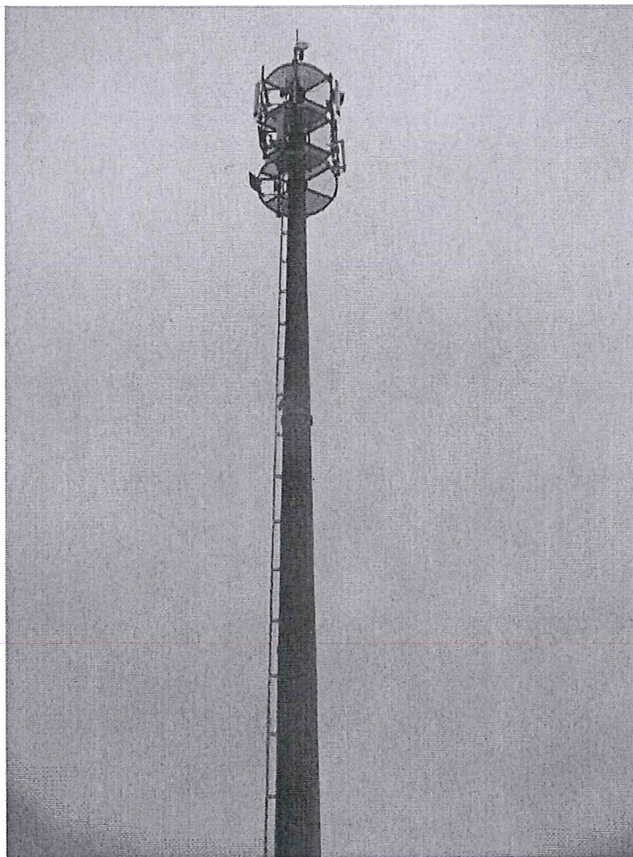
Zal. nr 1: Widok ogólny instalacji radiokomunikacyjnej.

Koniec sprawozdania. Sprawozdanie zawiera dodatkowo załączniki nr 1 i 2.