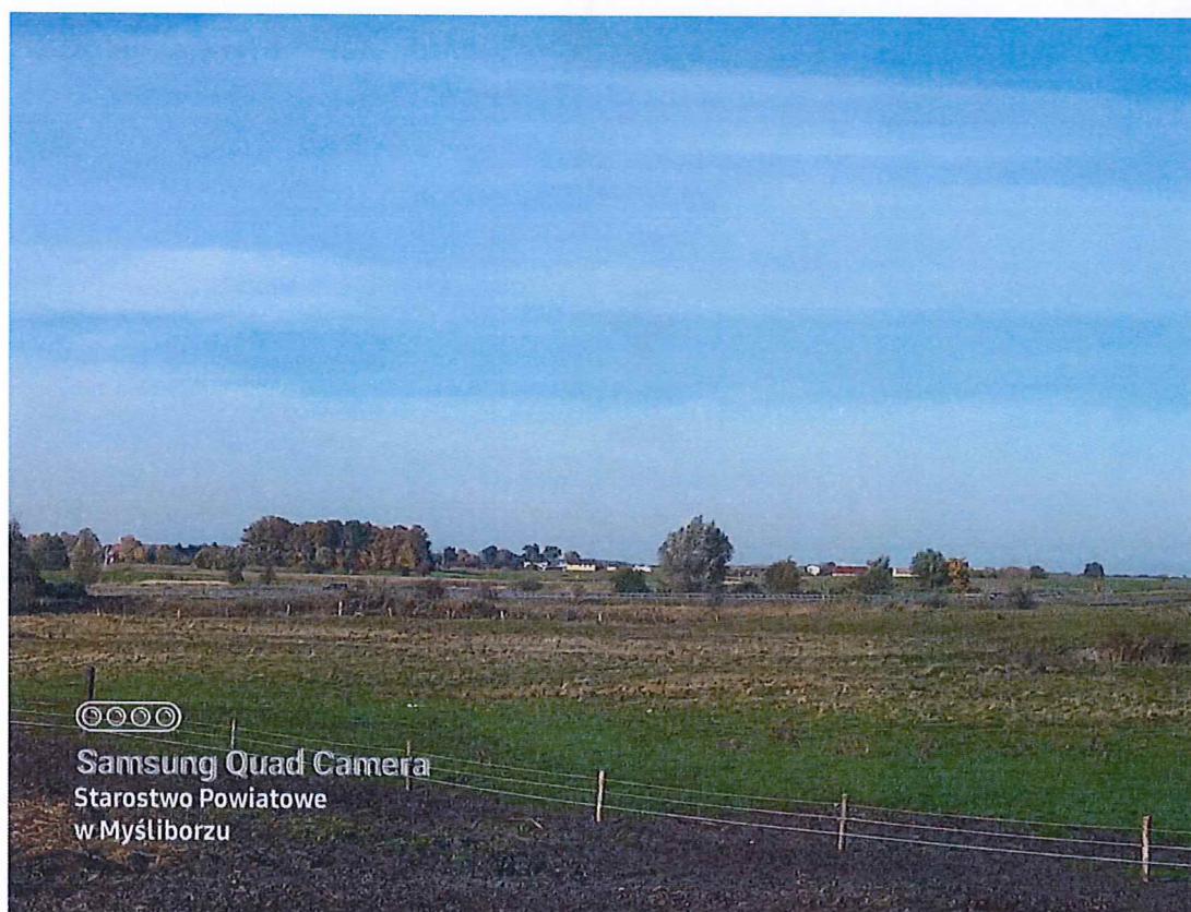
Fot. 3 Widok ogólny na teren osuwiska.