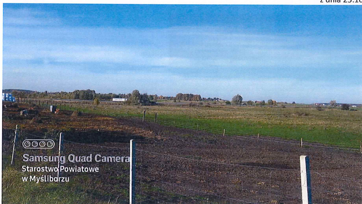
Fot. 2 Widok ogólny na teren osuwiska (teren pastwiska i nieużytku za ogrodzeniem).