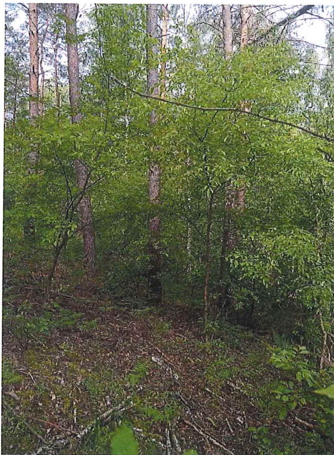
Fot. 2 Widok ogólny na osuwisko – góra skarpy.