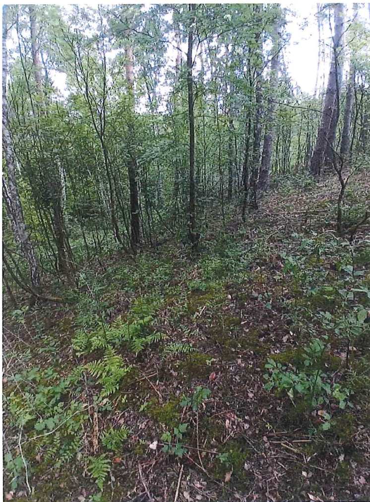
Fot. 4 Widok ogólny na osuwisko.