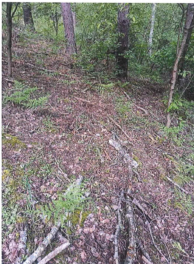
Fot. 3 Widok ogólny na osuwisko – góra skarpy.