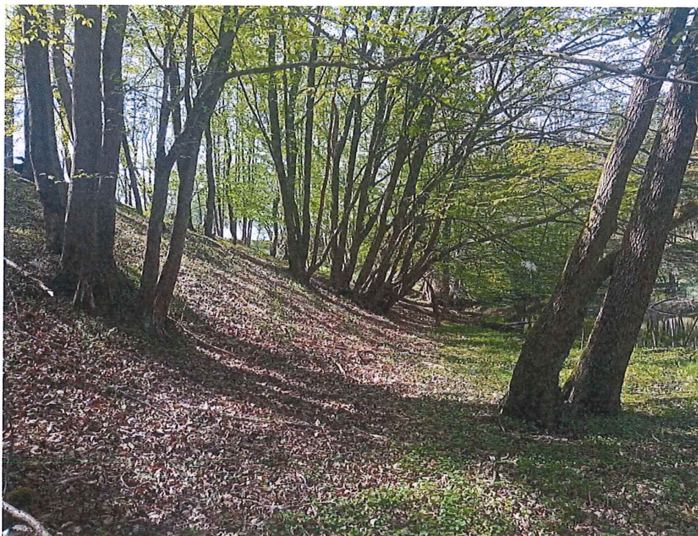
Fot. 3 Widok na teren, na którym występują ruchy masowe ziemi okresowo – zadrzewiony – nie stwierdzono „gołym okiem” ruchów masowych ziemi; po prawej rzeka Myśla