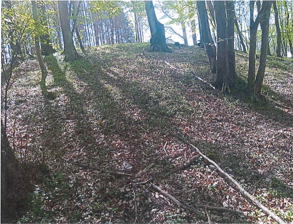
Fot. 5 Widok na teren, na którym występują ruchy masowe ziemi okresowo.