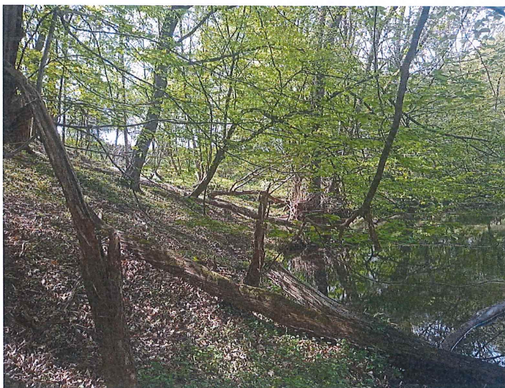
Fot. 4 Widok na teren, na którym występują ruchy masowe ziemi okresowo – nie stwierdzono „gołym okiem” ruchów masowych ziemi.