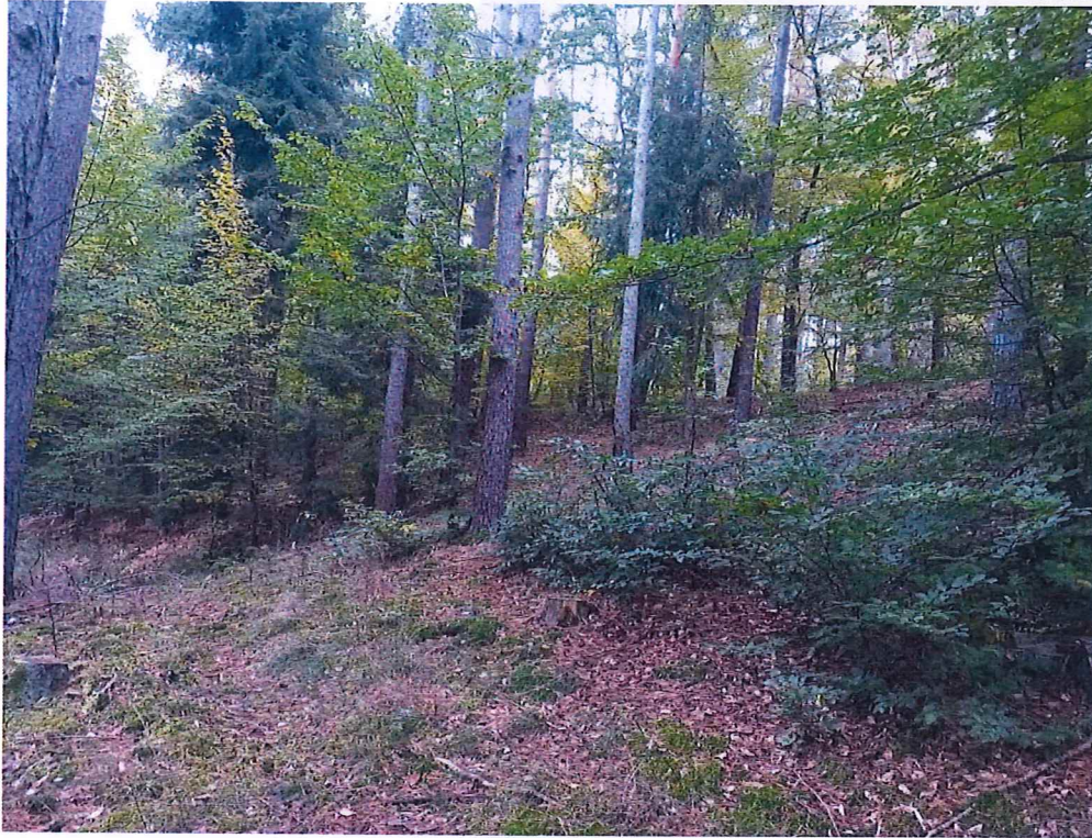
Fot. 2 Widok ogólny na teren osuwiska.