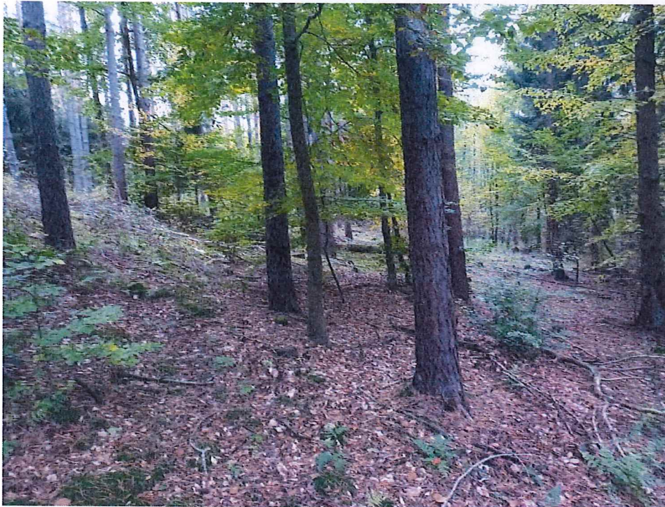
Fot. 3 Widok ogólny na teren osuwiska; w obrębie stoku poniżej osuwiska Kanał Kłodawski.