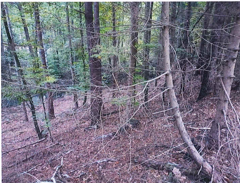
Fot. 3 Widok na teren osuwiska; brak śladów aktywności.