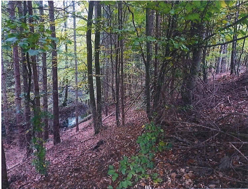
Fot. 2 Widok na teren osuwiska; widoczne zakole Kanału Kłodawskiego u podnóża zbocza.