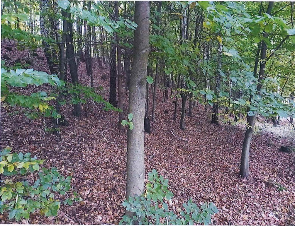
Fot. 2 Widok na teren osuwiska – jeden wyraźny pagórek koluwialny.