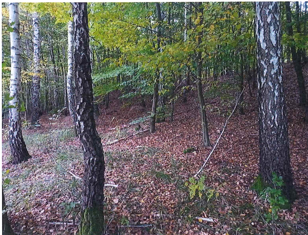
Fot. 4 Widok na osuwisko; nie stwierdzono „gołym okiem” ruchów masowych – brak śladów zsuwu.