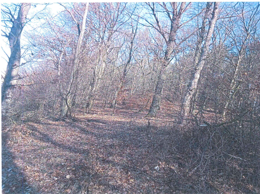
Fot. 2 Widok ogólny na wycinek terenu, na którym występują ruchy masowe ziemi;