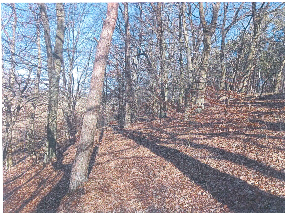
Fot. 2 Widok ogólny na wycinek terenu, na którym występują ruchy masowe ziemi; po prawej – droga gruntowa gminna (niewidoczna), po lewej łąki i pola uprawne (niewidoczne).