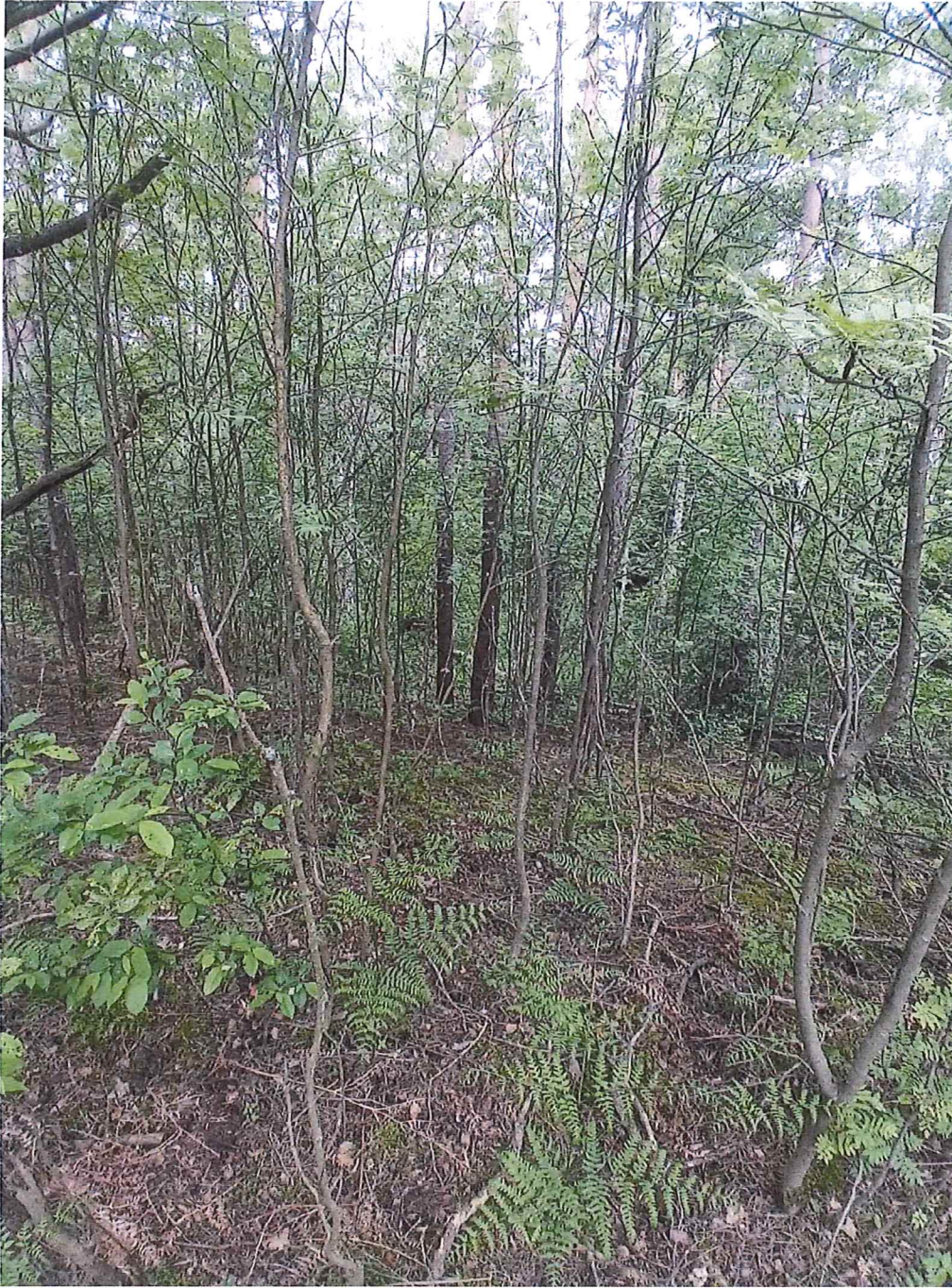
Fot. 3 Widok ogólny na osuwisko.