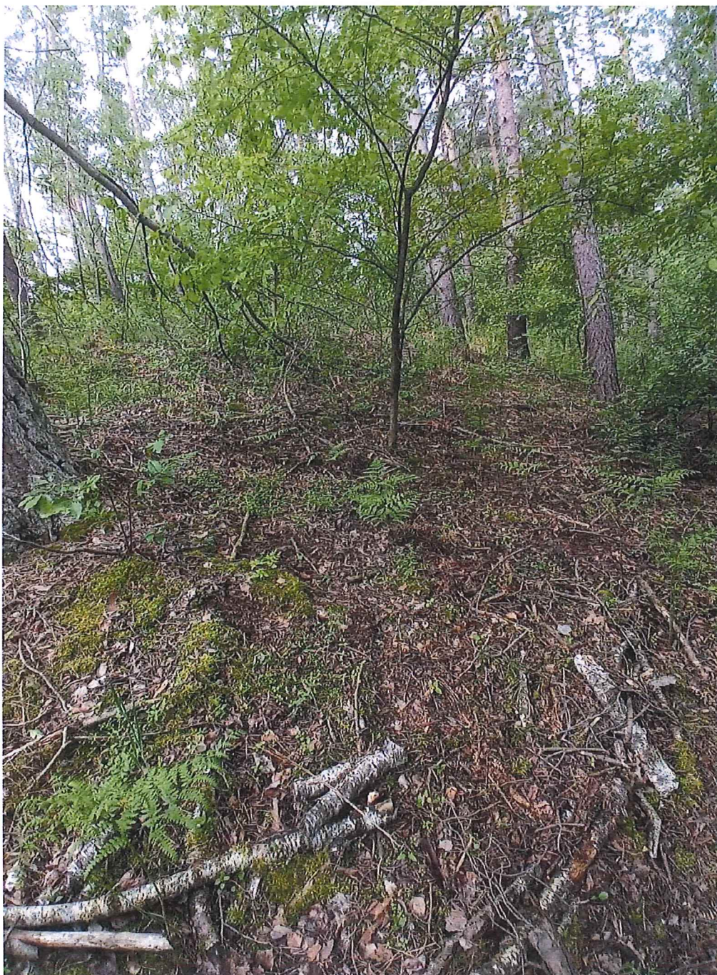
Fot. 2 Widok ogólny na osuwisko – górna część.