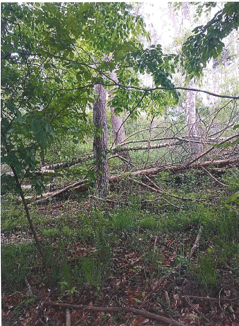
Fot. 4 Widok ogólny na osuwisko.