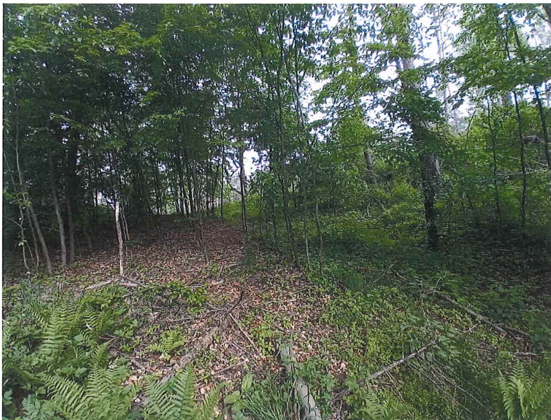
Fot. 2 Widok ogólny na osuwisko od strony północno zachodniej.