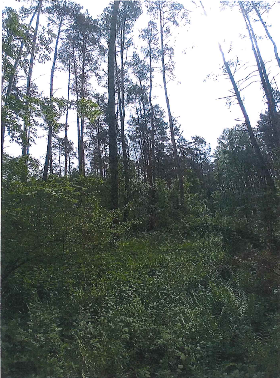
Fot. 3 Widok ogólny na osuwisko w kierunku północno-zachodnim.