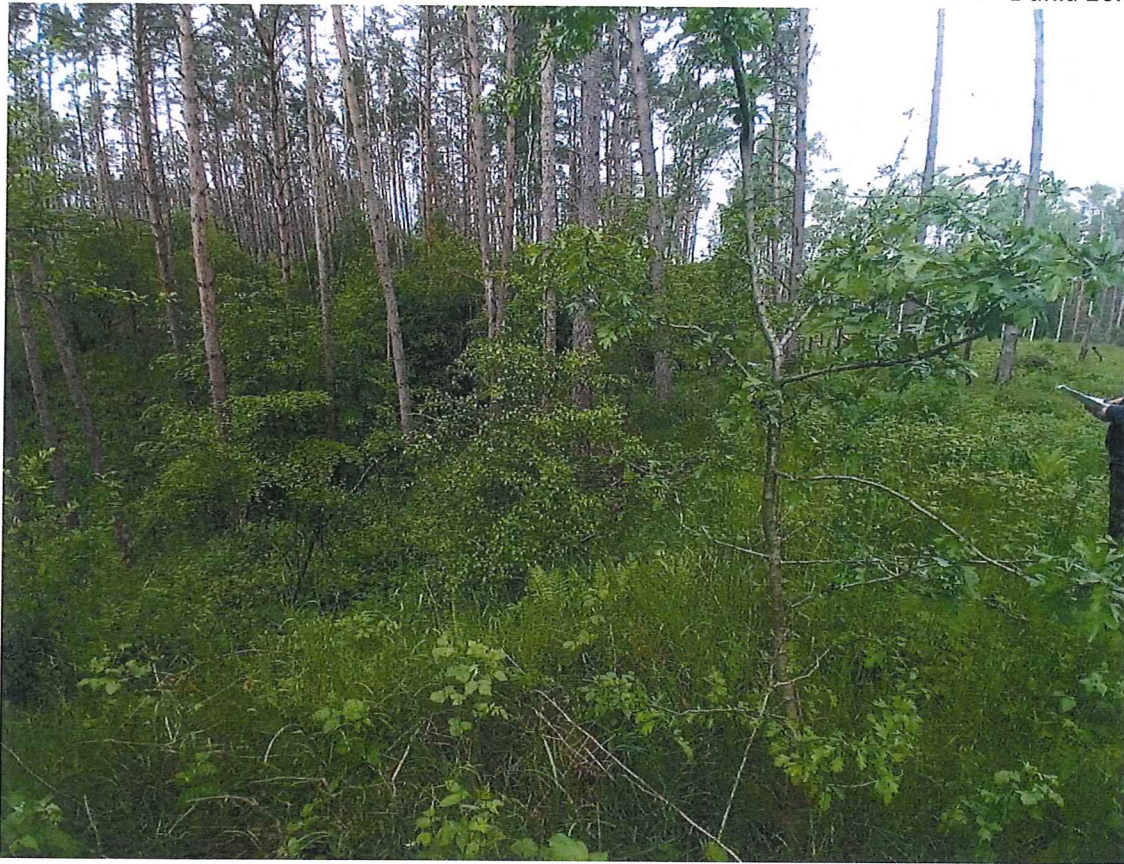
Fot. 2 Widok ogólny na osuwisko od strony północno-zachodniej.