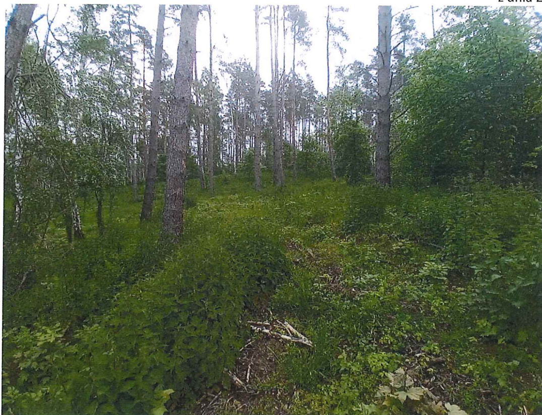
Fot. 3 Widok ogólny na osuwisko – grunt pokryty szatą roślinną – brak możliwości przeprowadzenia obserwacji terenu.