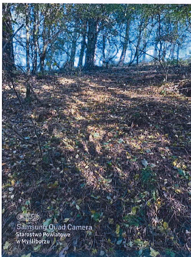
Fot. 3 Widok na teren osuwiska.