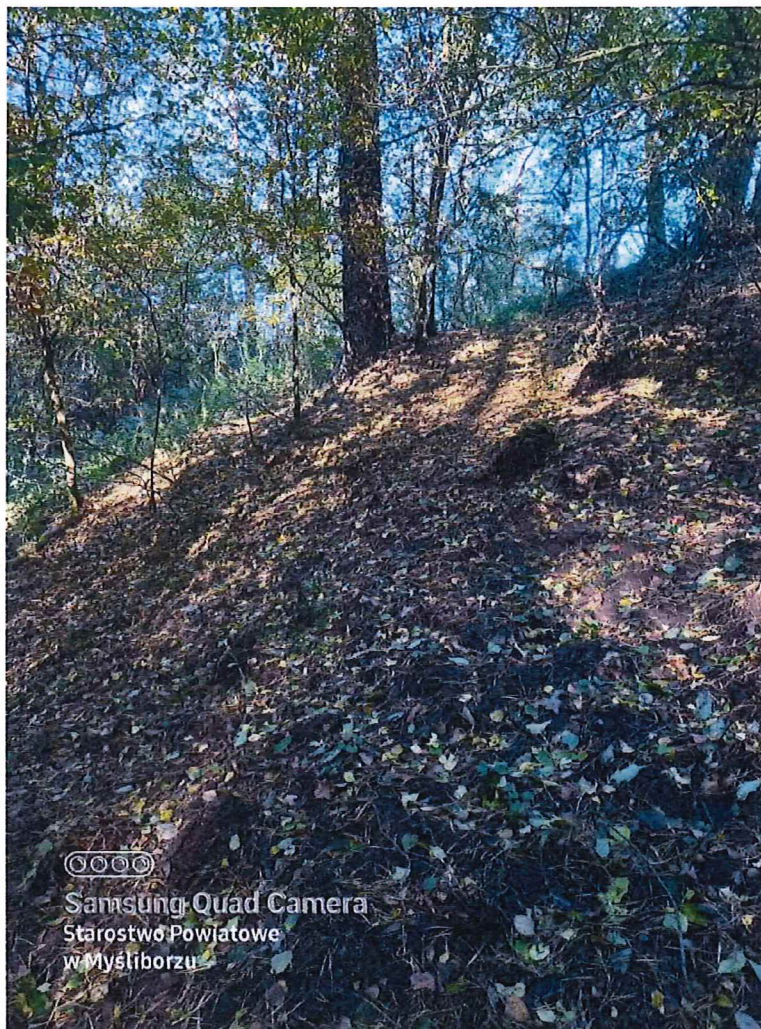
Fot. 4 Widok na teren osuwiska; nie stwierdzono „gołym okiem” ruchów masowych ziemi.