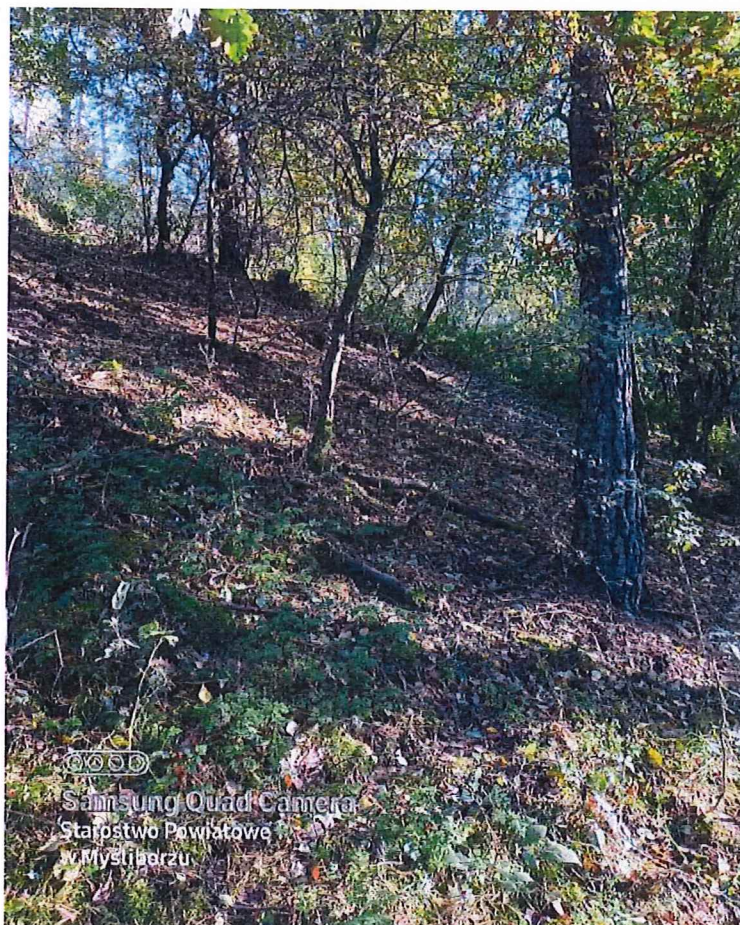
Fot. 2 Widok ogólny na teren osuwiska.