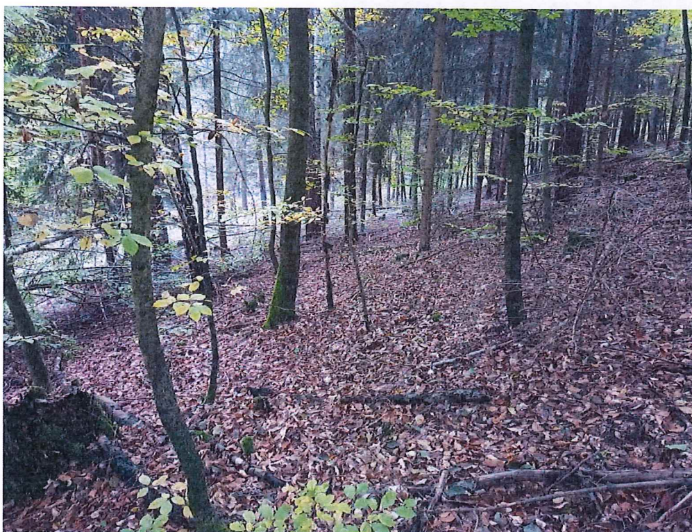
Fot. 3 Widok ogólny na teren osuwiska.