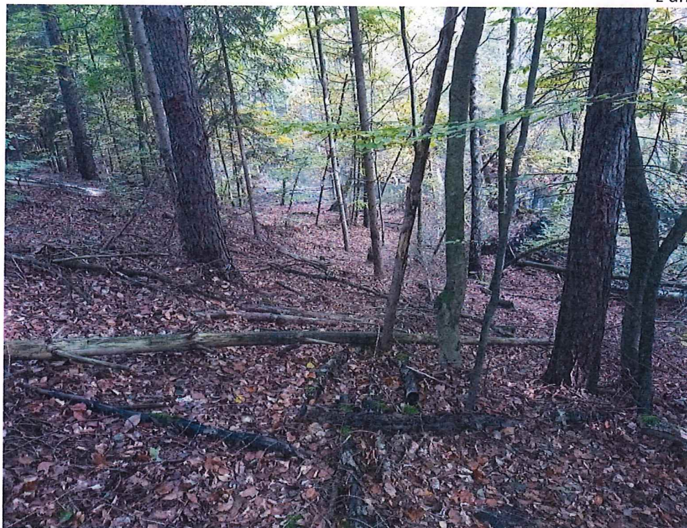
Fot. 2 Widok na teren osuwiska; w obrębie stoku poniżej osuwiska Kanał Kłodawski.