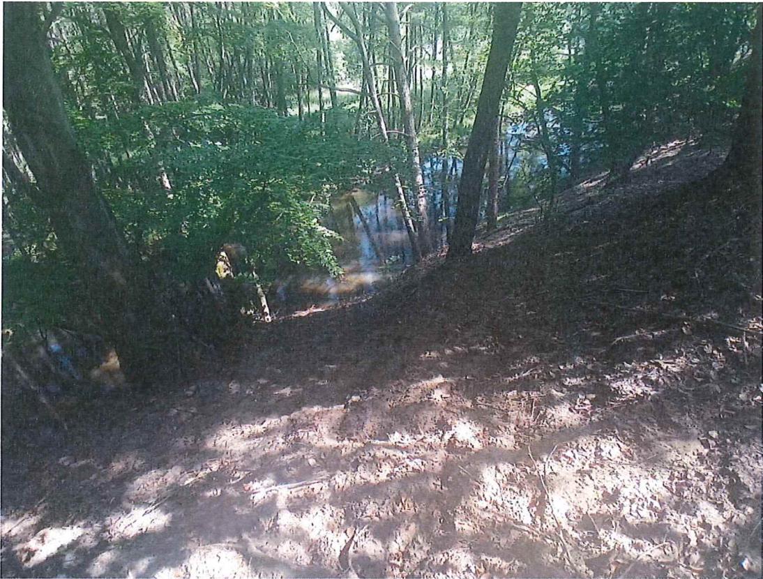
Fot. 4 Widok na część wschodnią osuwiska.