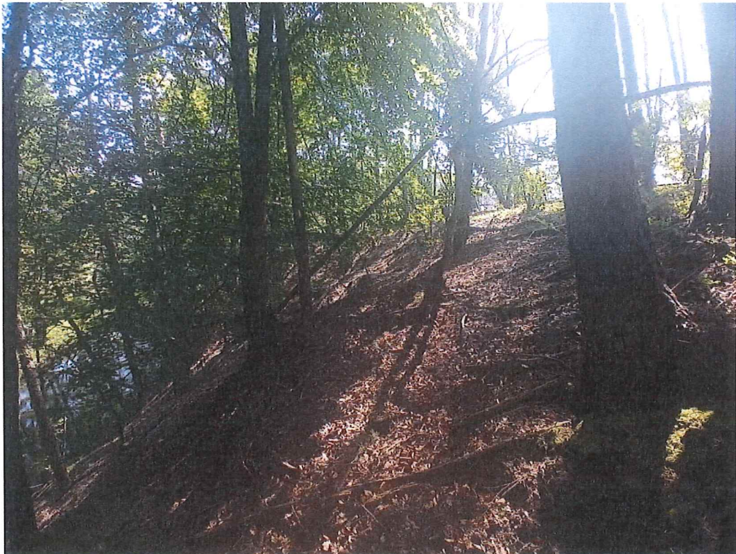
Fot. 5 Widok na część wschodnią osuwiska.