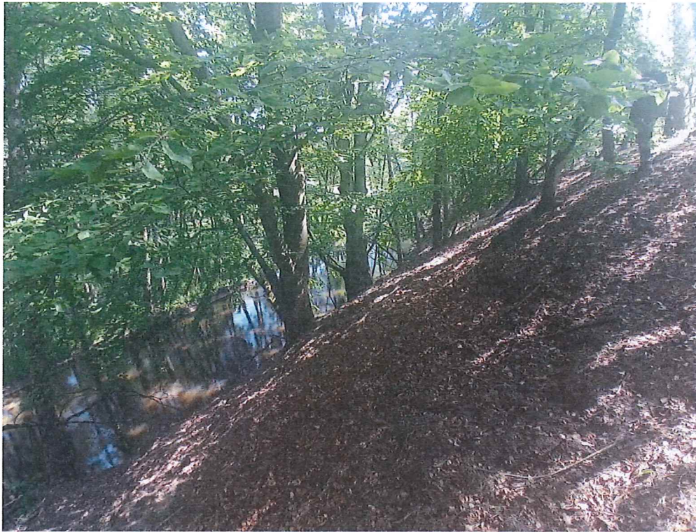
Fot. 2 Widok na część zachodnią osuwiska– koluwia osuwiskowe schodzące do rzeki Myśli.