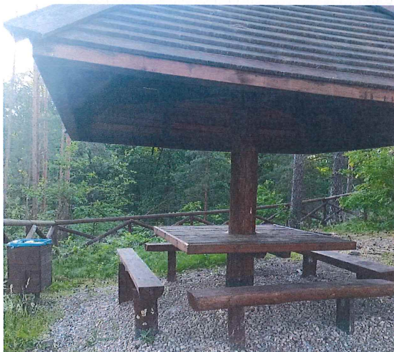
Fot. 5 Infrastruktura turystyczna zlokalizowana na górze skarpy osuwiska – za ogrodzeniem zbocze osuwiska i u podnóża rzeka Myśla.