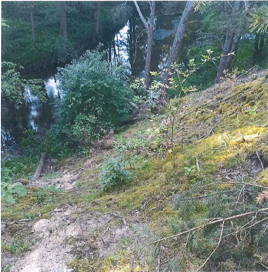
Fot. 6 Widok na zbocze osuwiska za ogrodzeniem miejsca odpoczynku z Fot. 5.