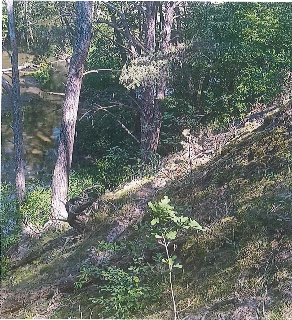
Fot. 4 Zbocze osuwiska – u podnóża rzeka Myśla.