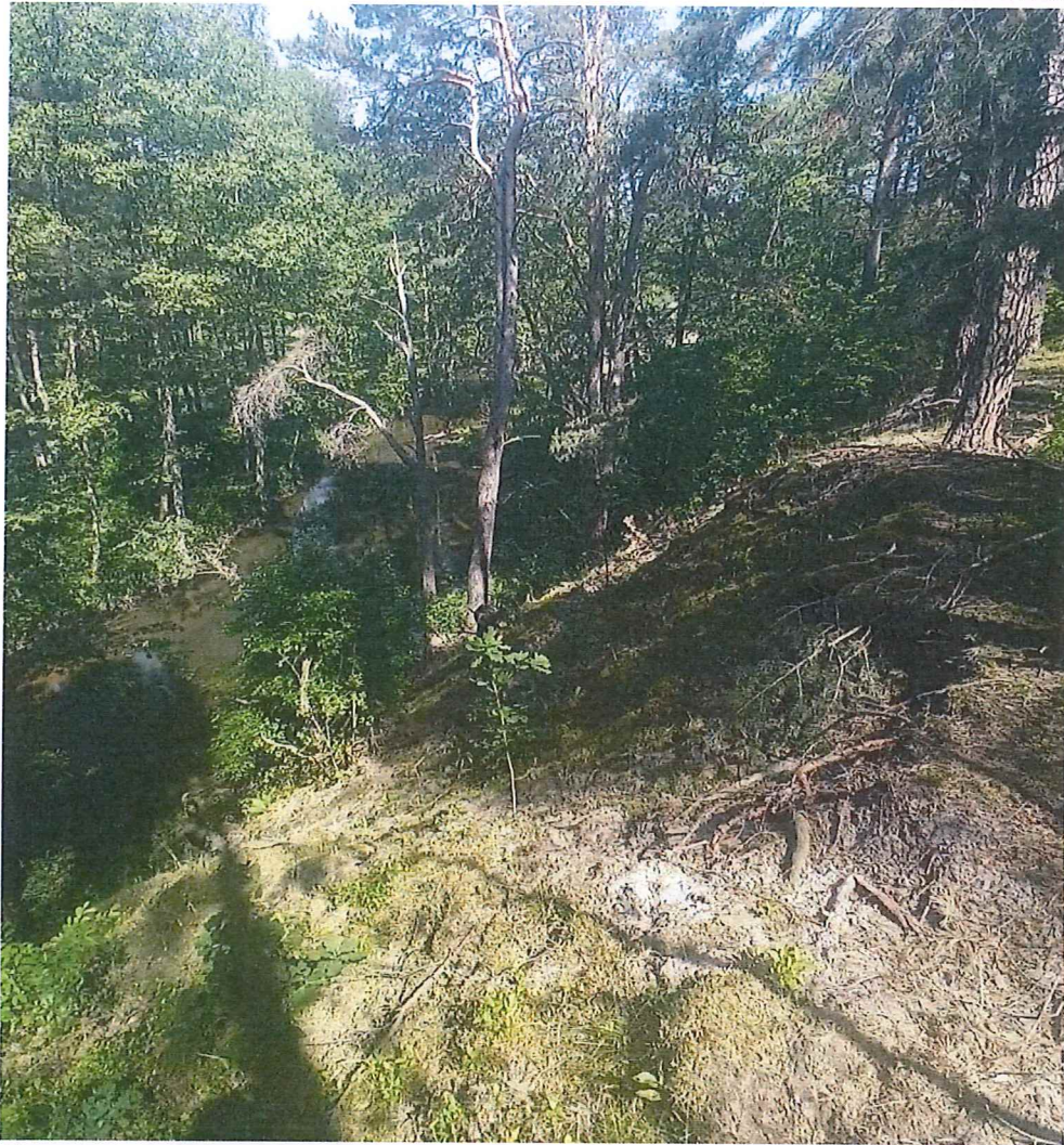
Fot. 2 Skarpa główna osuwiska z widocznymi obrywami – u podnóża rzeka Myśla.