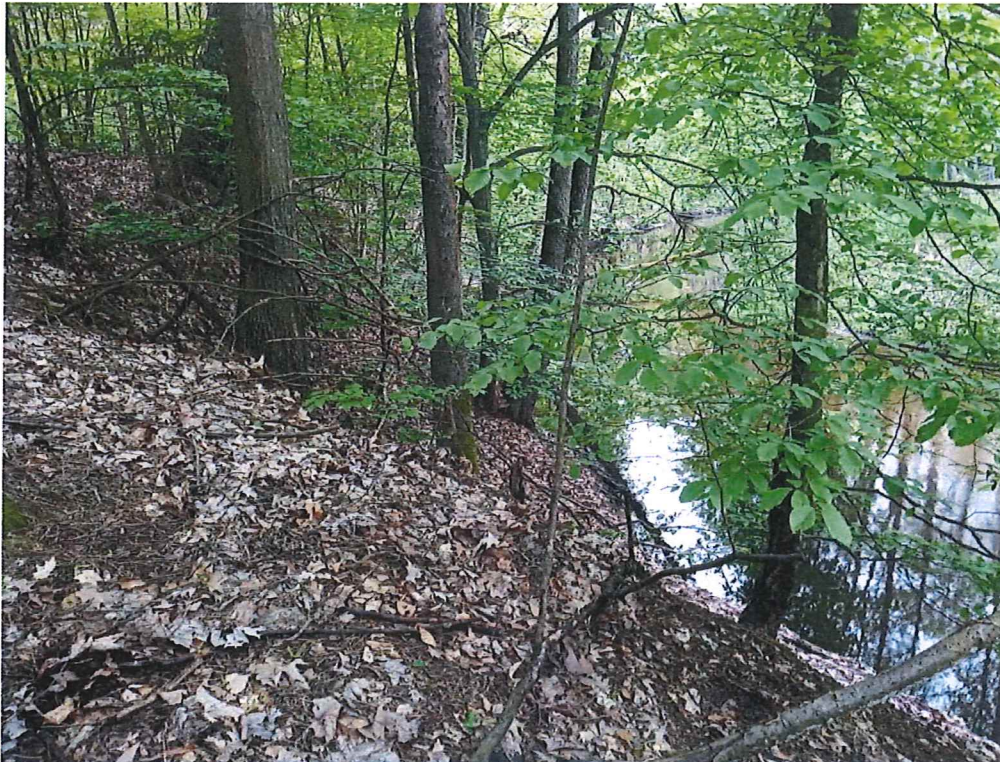
Fot. 4 Widok ogólny na osuwisko - nie stwierdzono „gołym okiem” ruchów masowych .