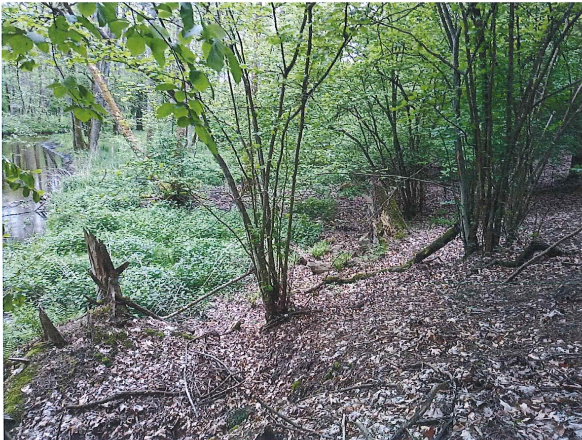
Fot. 3 Widok ogólny na osuwisko.