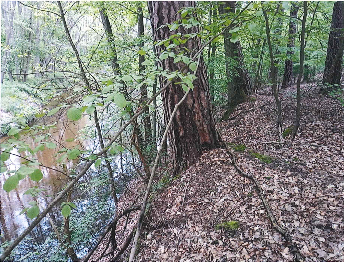
Fot. 2 Widok ogólny na osuwisko – południowe zbocze doliny rzeki Myśli.