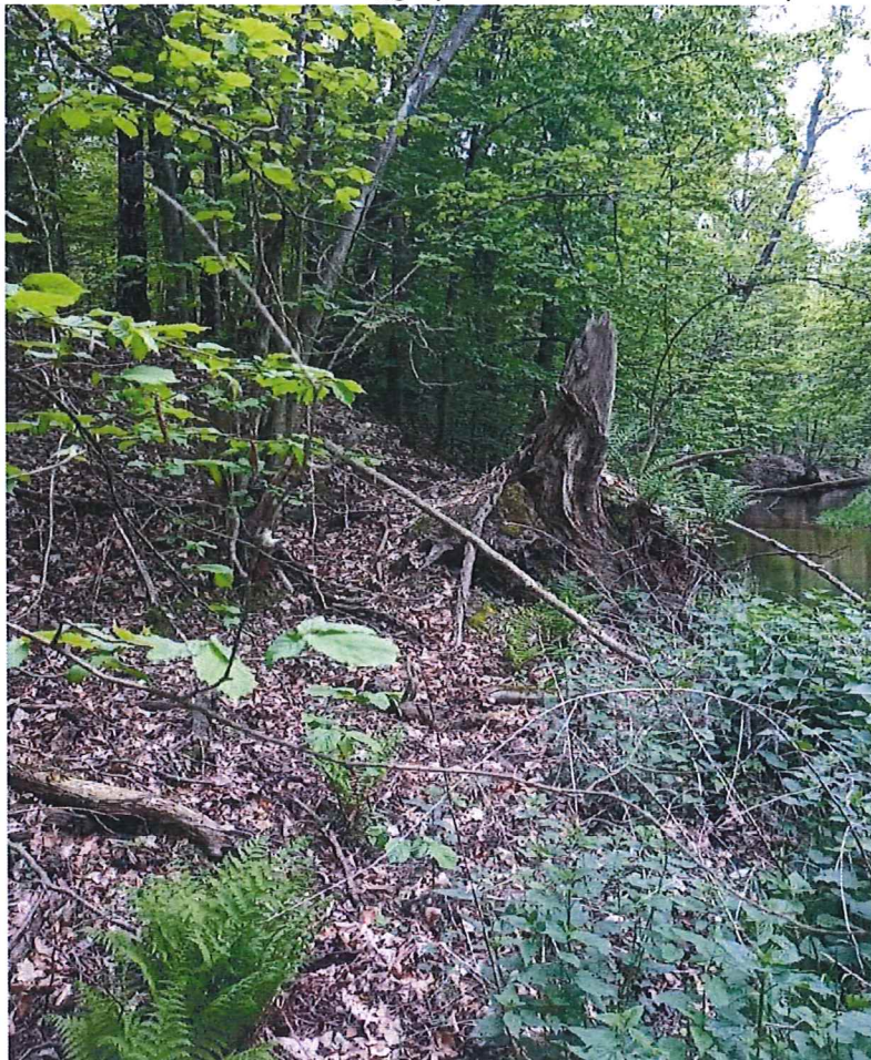
Fot. 5 Widok ogólny na osuwisko; ślady obrywów na zboczu.