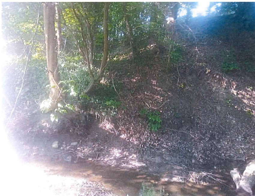
Fot. 2 Widok na teren osuwiska; widoczny ciek naturalny Dopływ z Różańska rozmywający dolną część koluwiów.