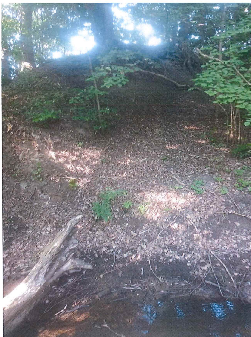
Fot. 3 Widoczna wyraźna skarpa główna osuwiska.