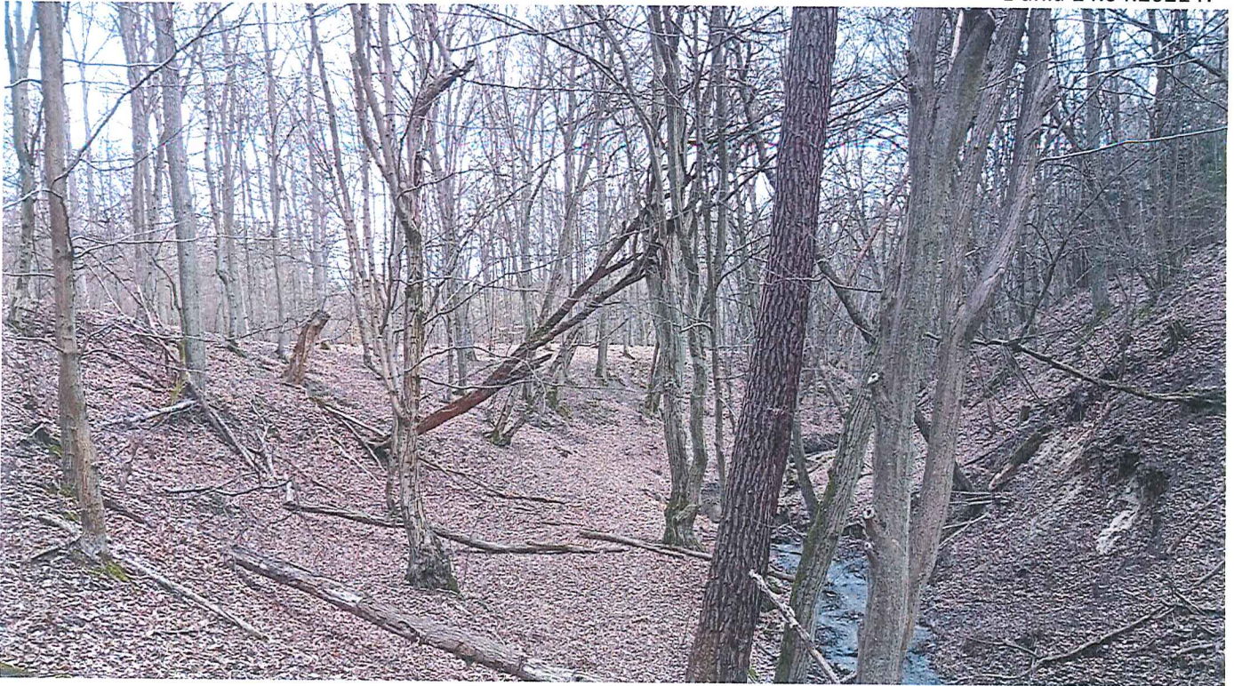
Fot. 2 Widok ogólny osuwiska; widoczny ciek naturalny w dolinie.