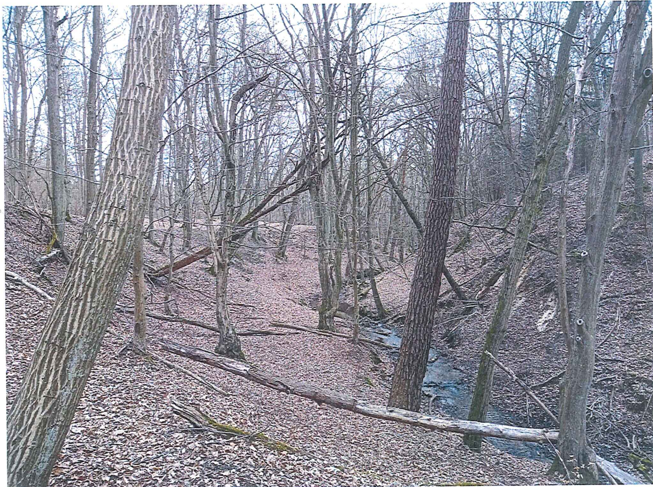
Fot. 4 Widok ogólny na osuwisko (po lewej); nie stwierdzono „gołym okiem” ruchów osuwiskowych .