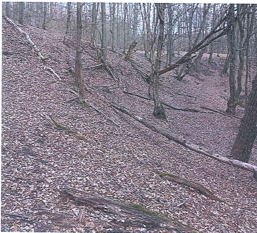
Fot. 3 Widok ogólny osuwiska.