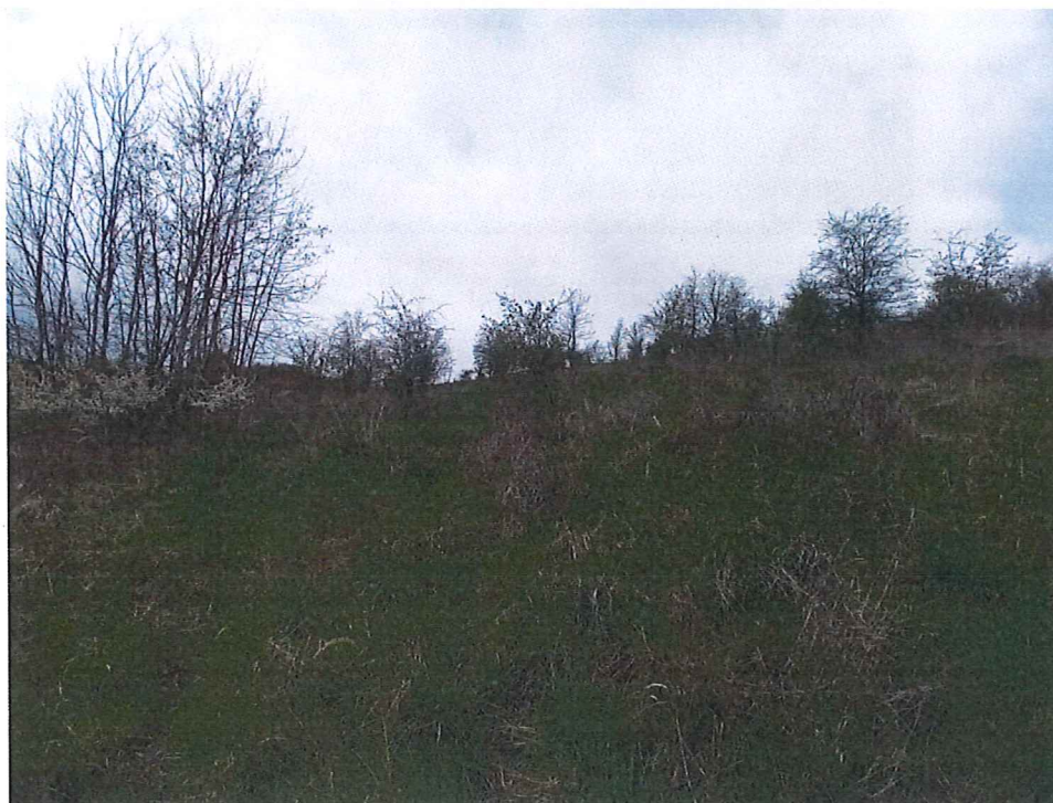
Fot. 3 Widok ogólny na wycinek terenu, na którym występują ruchy masowe ziemi – zajmuje stromą część stoku.