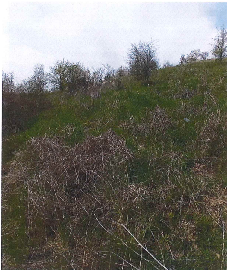
Fot. 2 Widok skarpy górnej terenu, na którym występują ruchy masowe ziemi – osuwisko nieaktywne; zarośnięte wysokimi trawami, trzciną i tarniną.