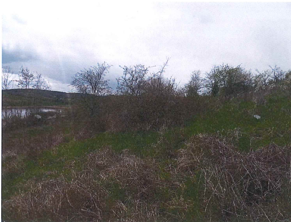
Fot. 2 Widok skarpy górnej terenu, na którym występują ruchy masowe ziemi – osuwisko nieaktywne; zarośnięte trawami, trzciną i tarniną – w dole widoczne stawy rybne.