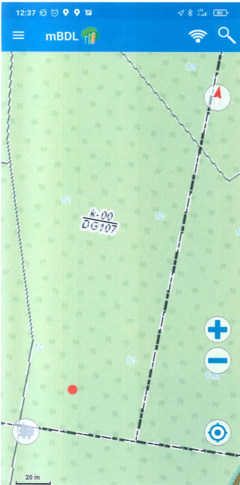
Fot. 2 Lokalizacja miejsca wizji przy użyciu aplikacji mobilnej mBDL (Bank Danych o Lasach) – informacja o numerze działki i oddziału leśnego.