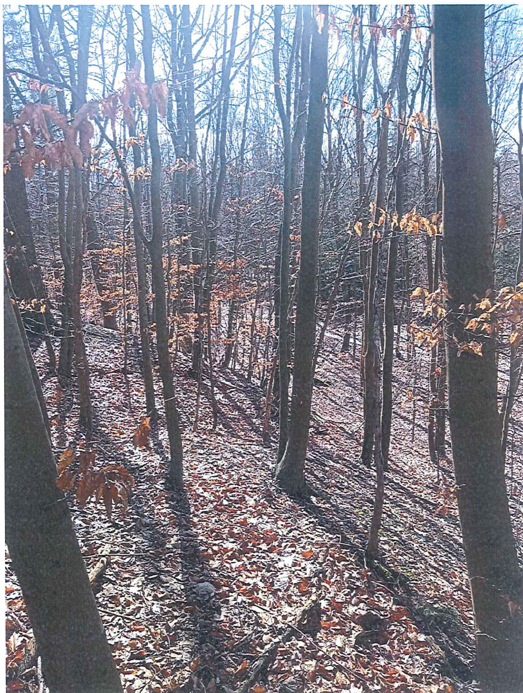
Fot. 3 Widok ogólny na wycinek terenu zagrożonego ruchami masowymi ziemi.