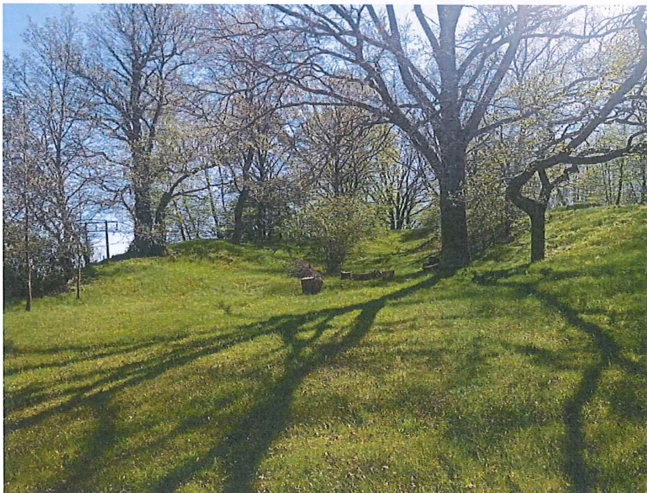
Fot. 4 Widok na teren zagrożony ruchami masowymi ziemi od strony zachodniej o wyraźnie nierównej morfologii.