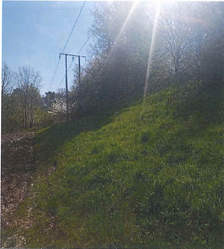
Fot. 3 Widok ogólny na północną część terenu zagrożonego ruchami masowymi ziemi – drobne ślady spętywania, brak znacznego przemieszczania się gruntu, osunięcia ziemi; słup linii przesyłowych nieprzechylony, nieuszkodzony.