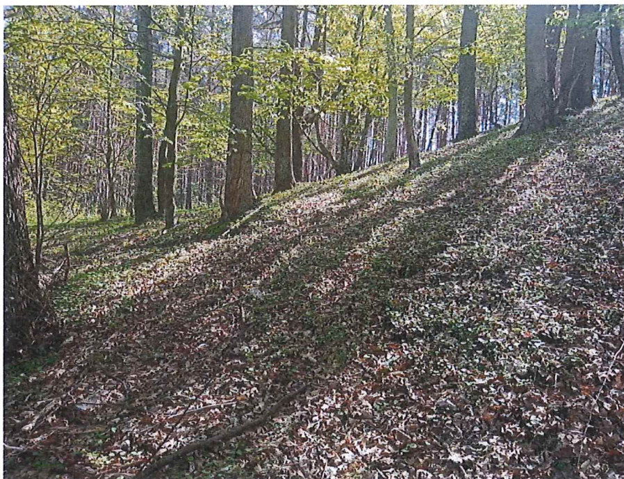
Fot. 3 Widok na teren zagrożony ruchami masowymi ziemi.