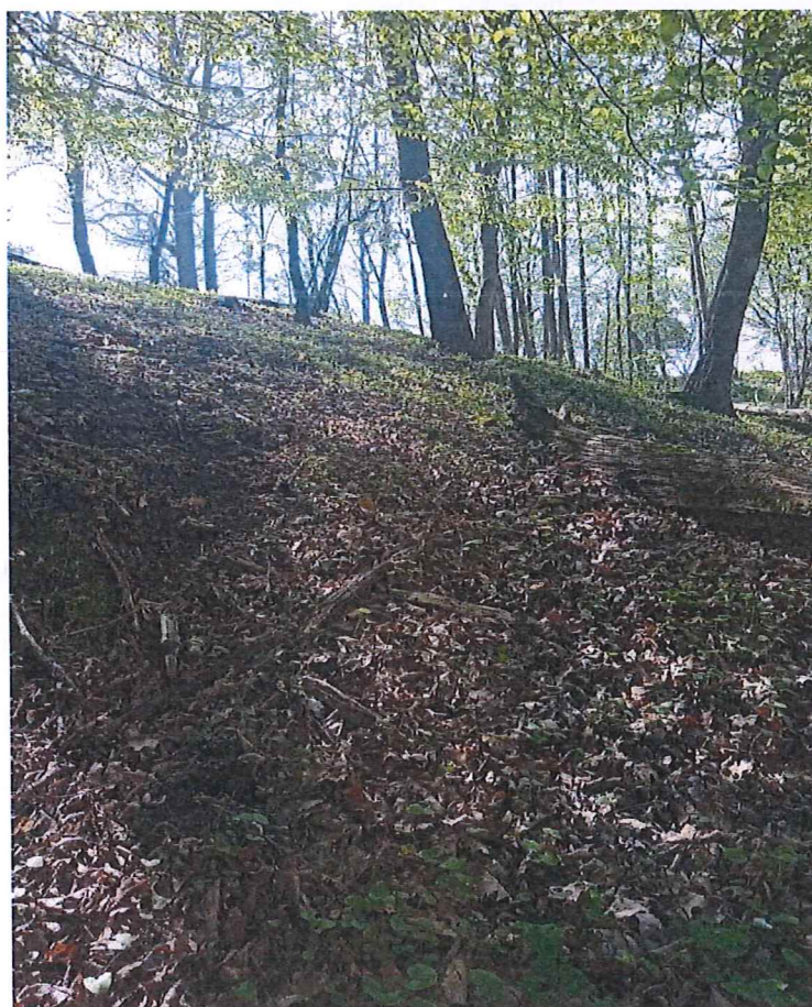
Fot. 4 Widok na teren zagrożony ruchami masowymi ziemi – widoczne poprzeczylane drzewa.