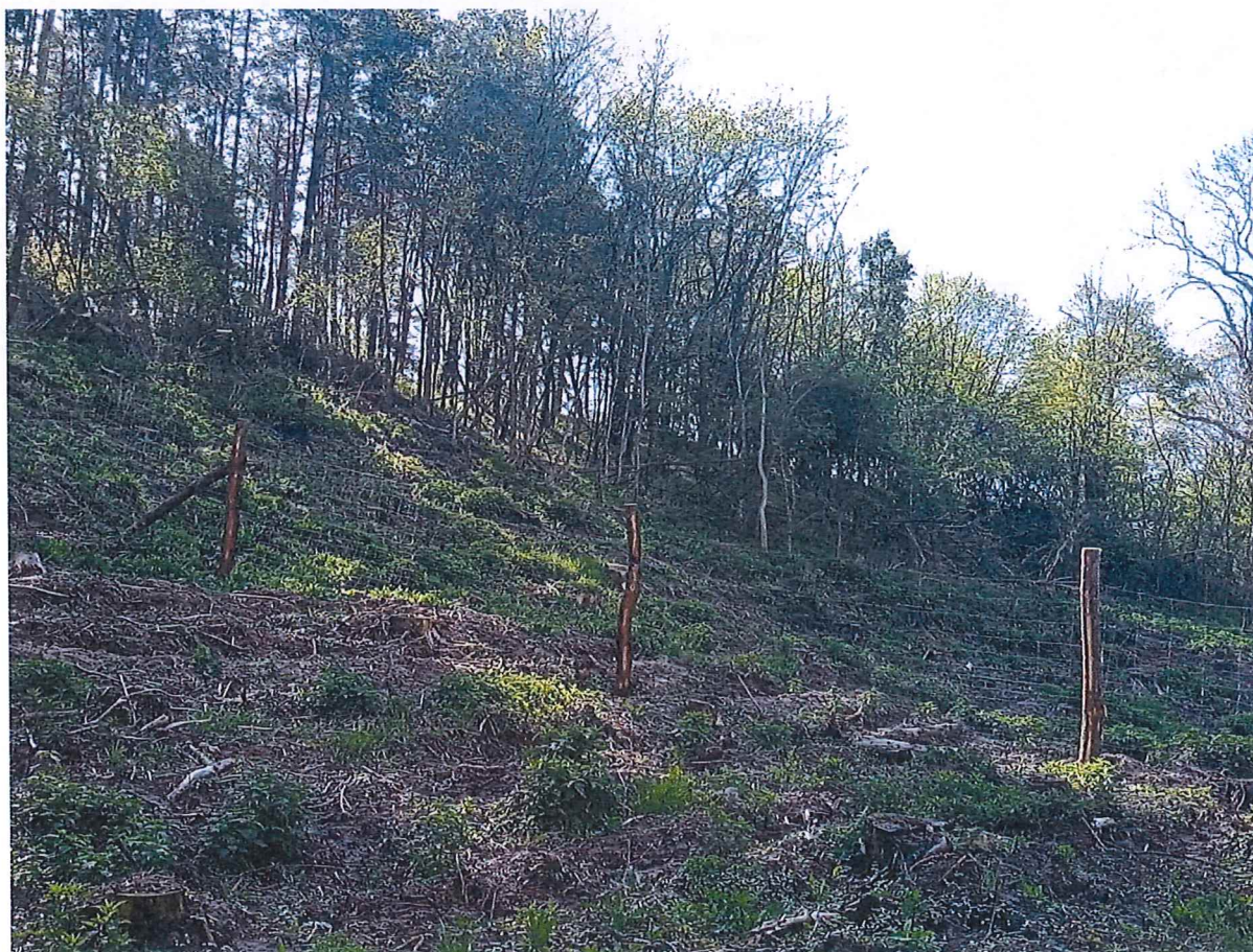
Fot. 4 Widok ogólny na teren zagrożony ruchami masowymi ziemi; widoczny wyrąb drzew na zboczu.