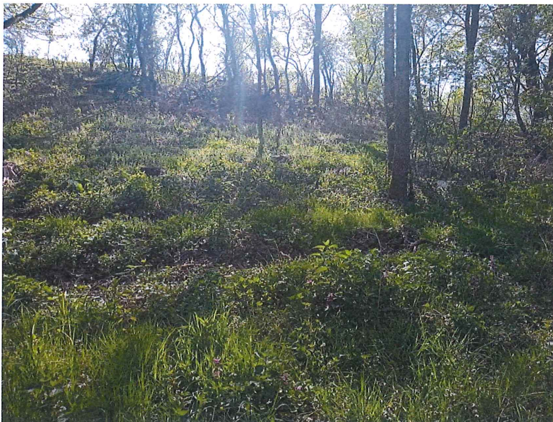
Fot. 5 Widok ogólny na teren zagrożony ruchami masowymi ziemi; nie stwierdzono „gołym okiem” ruchów masowych – drobne ślady spęływania ziemi po zboczu.