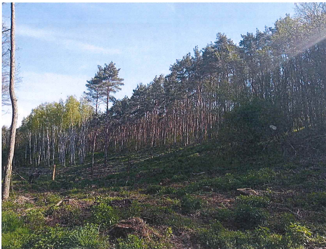
Fot. 3 Widok ogólny na teren zagrożony ruchami masowymi ziemi; widoczny wyrąb drzew na zboczu; po stronie lewej (niewidoczna na zdjęciu) rzeka Myśla.