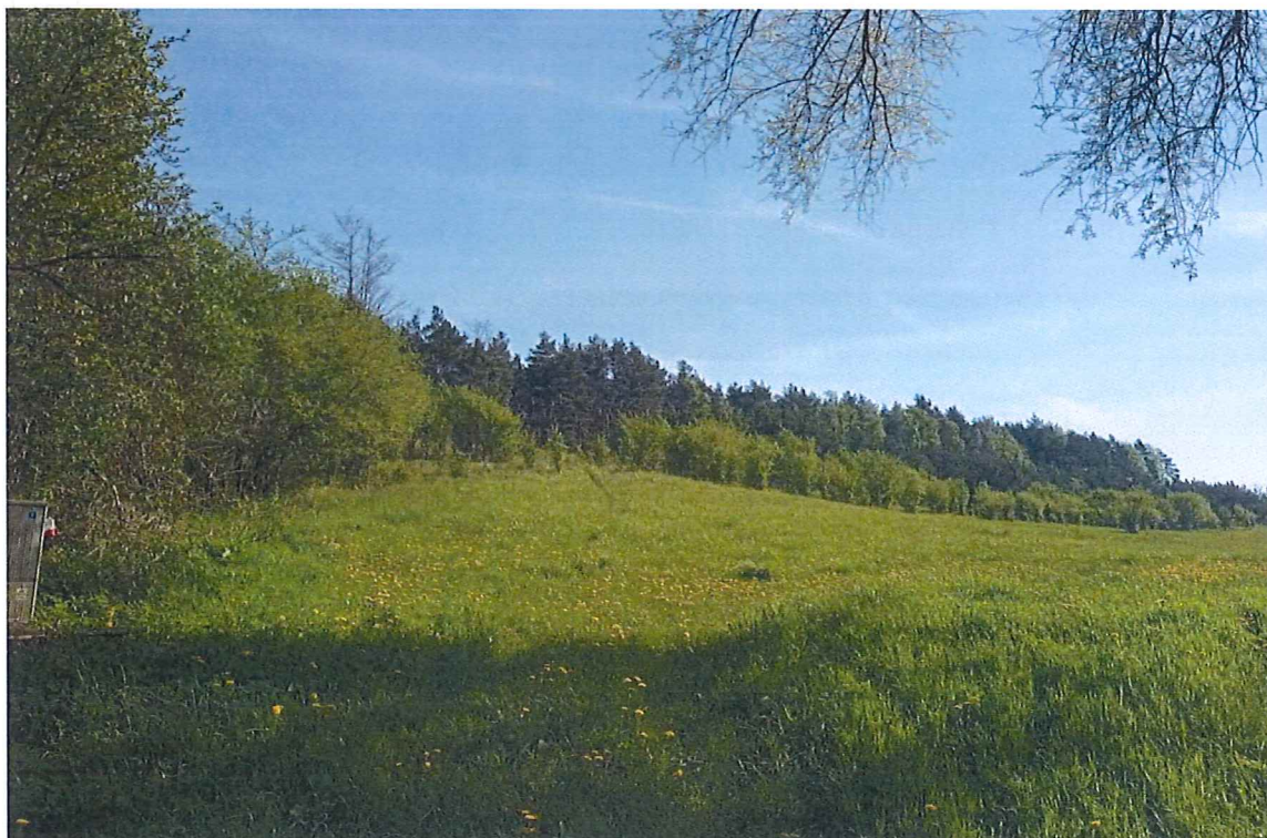
Fot. 6 Widok ogólny na teren zagrożony ruchami masowymi ziemi od strony południowej; nie stwierdzono „gołym okiem” ruchów masowych.