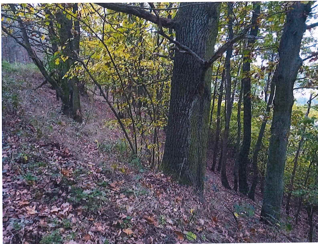
Fot. 4 Widok na teren zagrożony ruchami masowymi ziemi; nie stwierdzono „gołym okiem” ruchów masowych – np. spękań, zsuwów po zboczu.