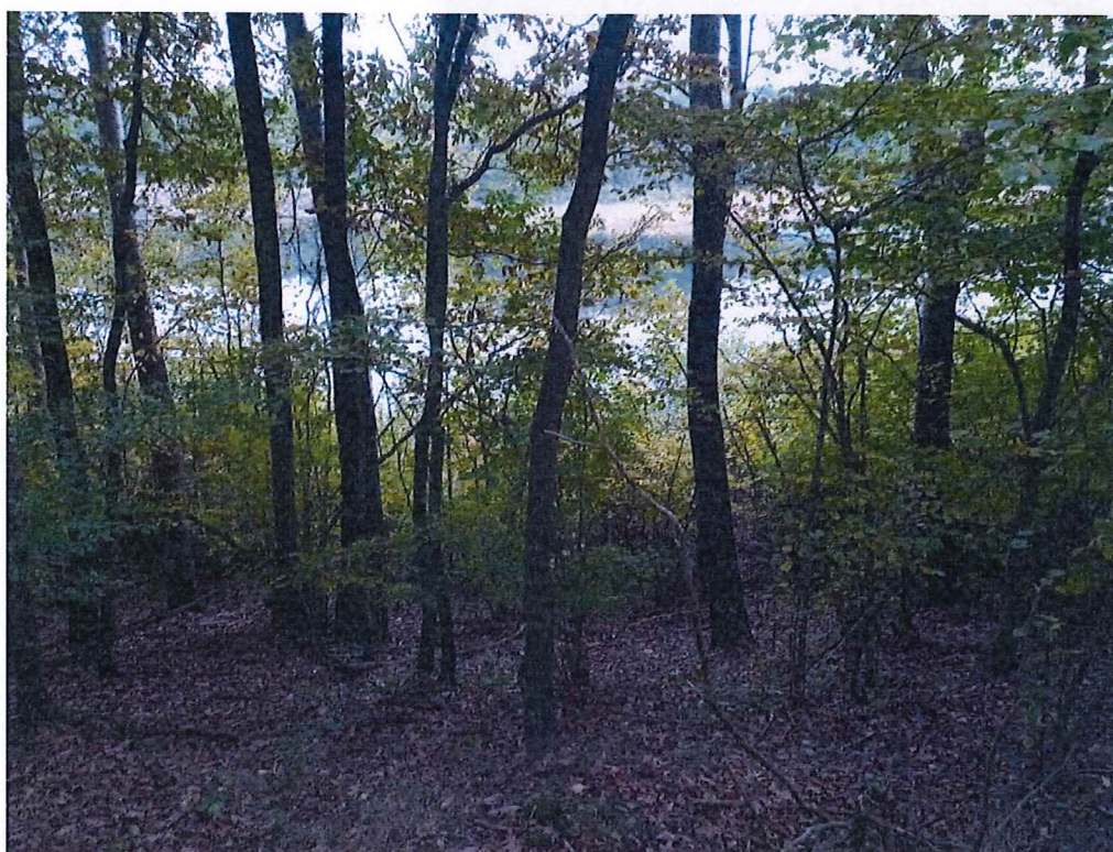
Fot. 3 Widok na teren zagrożony ruchami masowymi ziemi;