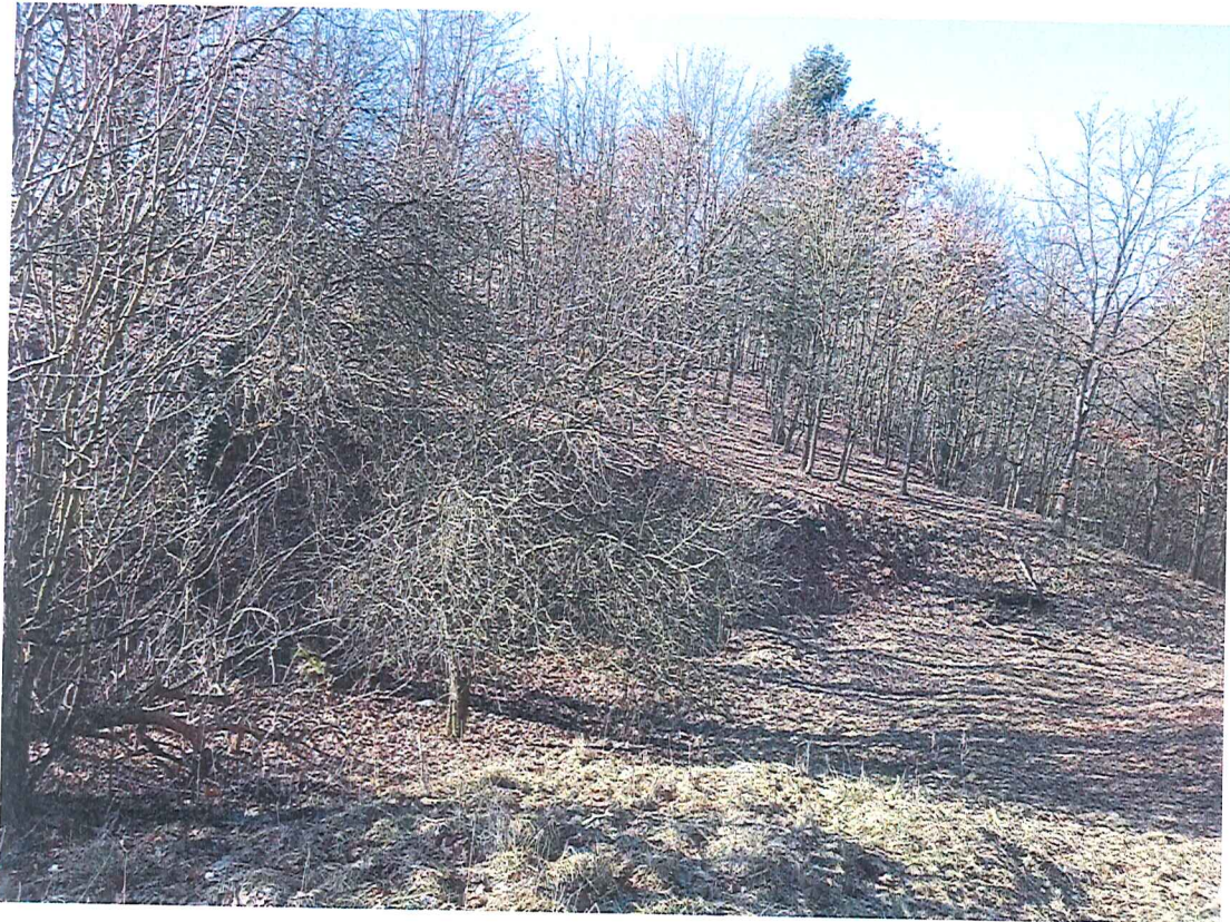
Fot. 2 Widok ogólny na wycinek terenu zagrożonego ruchami masowymi ziemi.