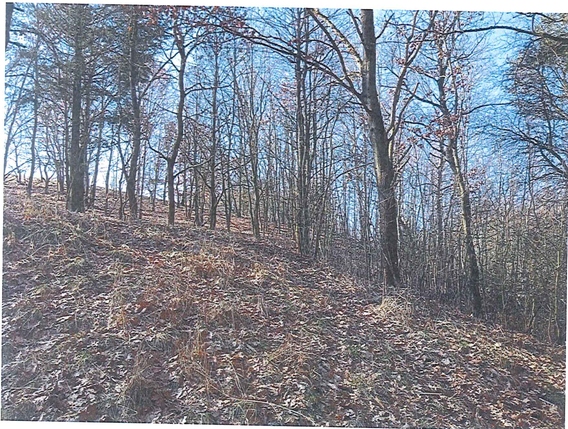
Fot. 3 Widok ogólny na wycinek terenu zagrożonego ruchami masowymi ziemi.