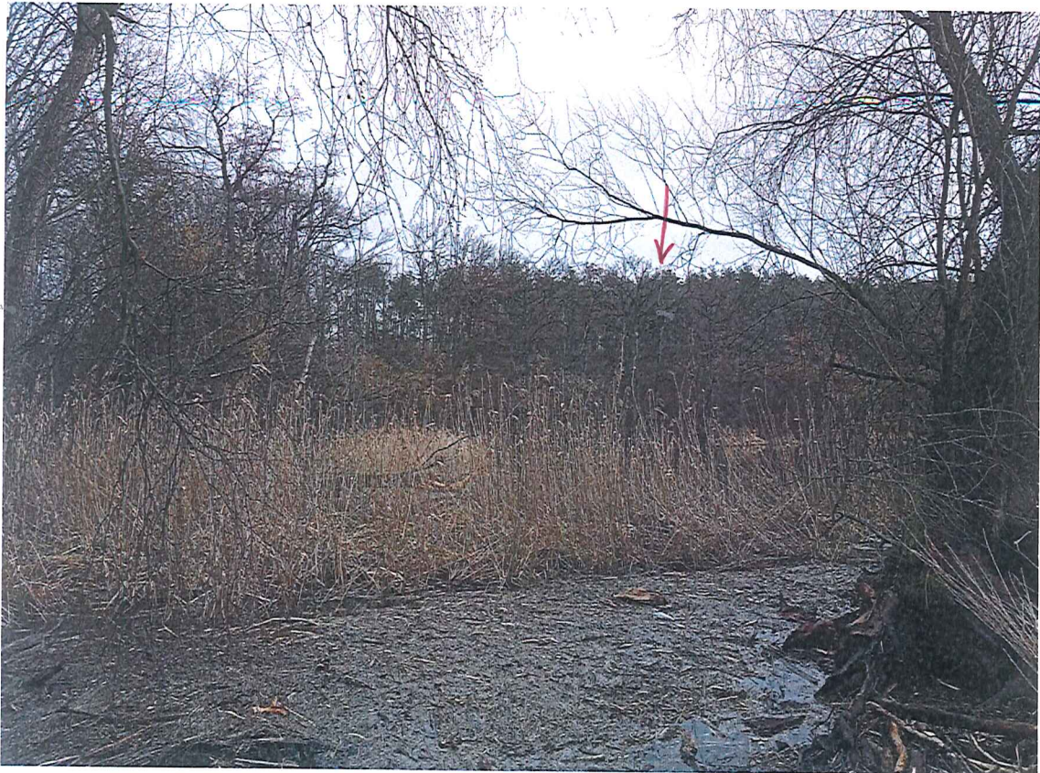
Fot. 2 Widok na wycinek terenu zagrożonego ruchami masowymi ziemi z przeciwległego brzegu Kanału Tarnów (Kanał Głęboki) - wypływ do jez. Tchórzyno.