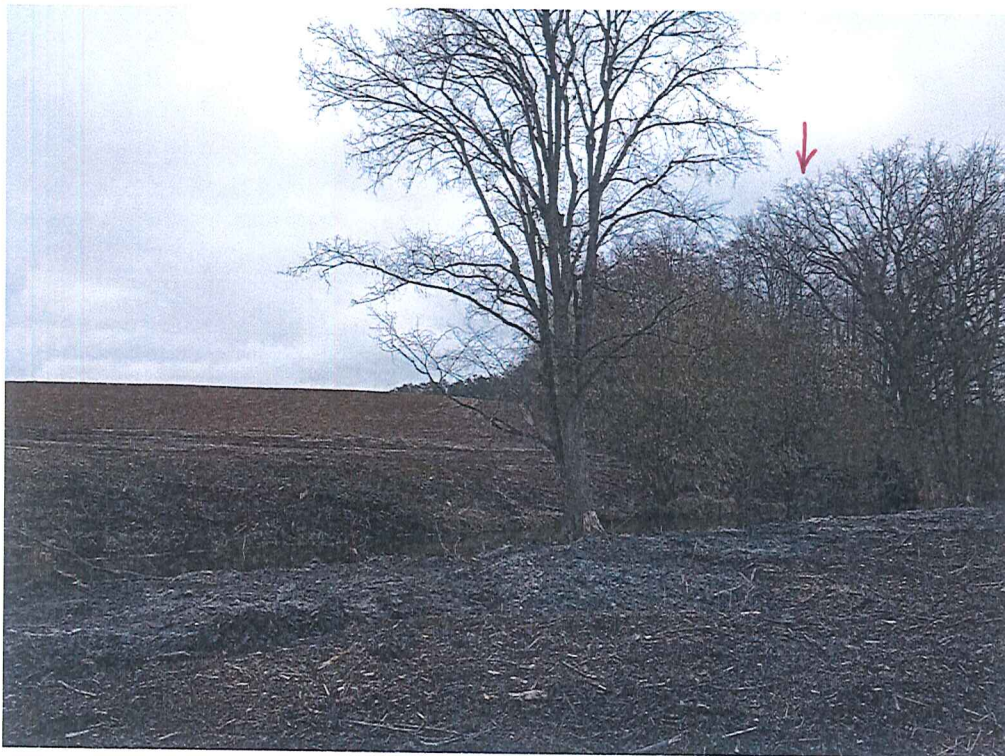
Fot. 3 Widok na wycinek terenu zagrożonego ruchami masowymi ziemi – prawa strona zdjęcia; za drzewem na pierwszym planie – Kanał Tarnów (Kanał Głęboki).