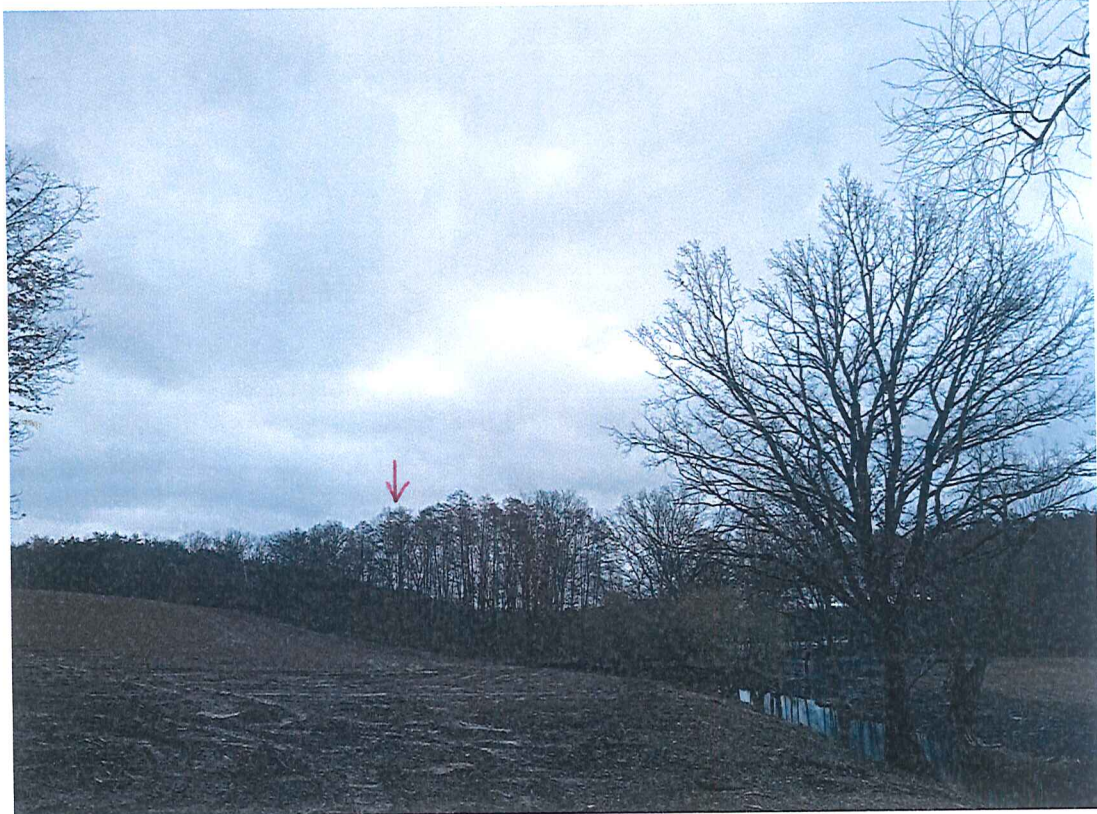
Fot. 4 Widok na wycinek terenu zagrożonego ruchami masowymi ziemi (w oddali)– widoczny trudny dostęp z powodu podmokłego terenu po obfitych deszczach; widoczny Kanał Tarnów (Kanał Głęboki).