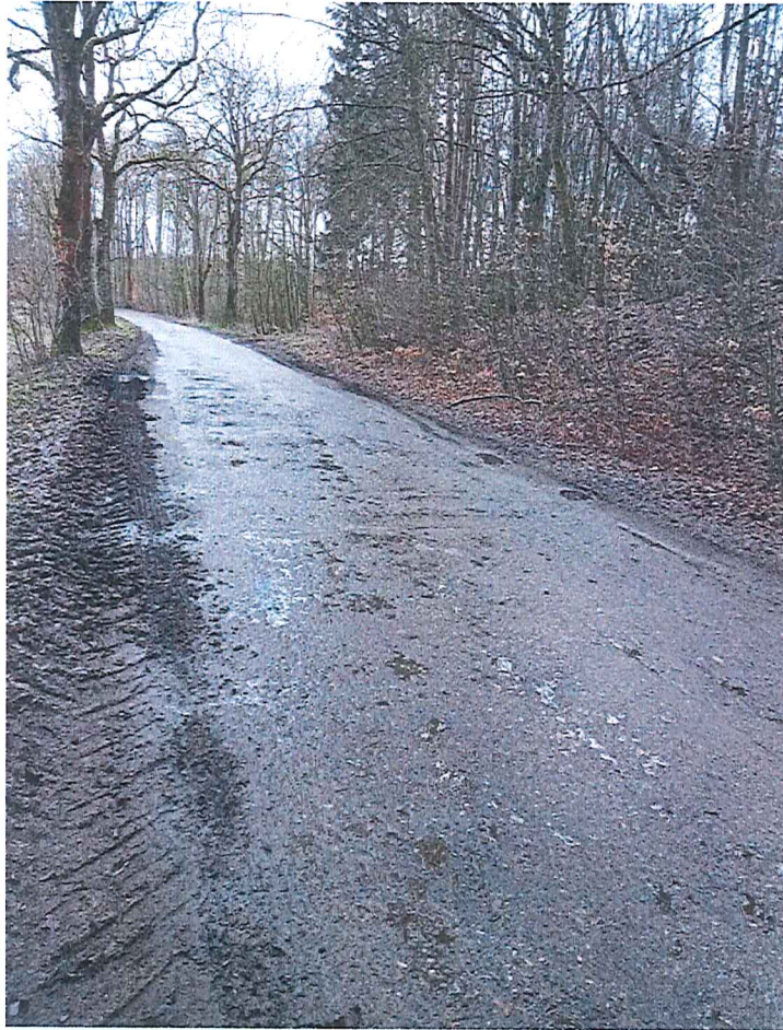
Fot. 6 Brak widocznych uszkodzeń lub zniszczeń drogi powiatowej nr 2102Z z powodu istnienia terenu zagrożonego ruchami masowymi ziemi (strona prawa zdjęcia)