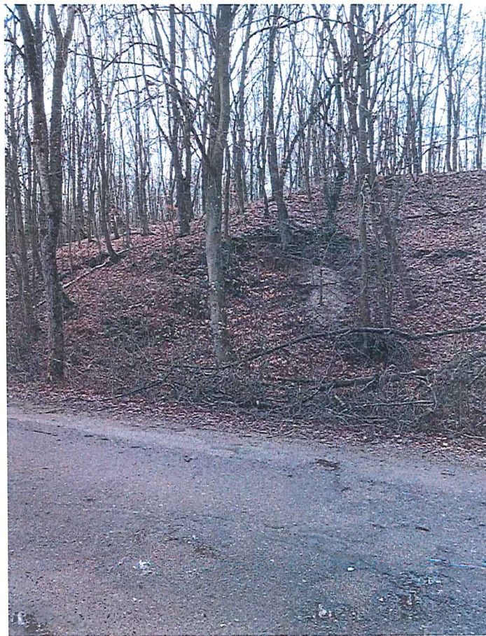
Fot. 5 Widok na wycinek terenu zagrożonego ruchami masowymi ziemi z drogi powiatowej nr 2102Z.