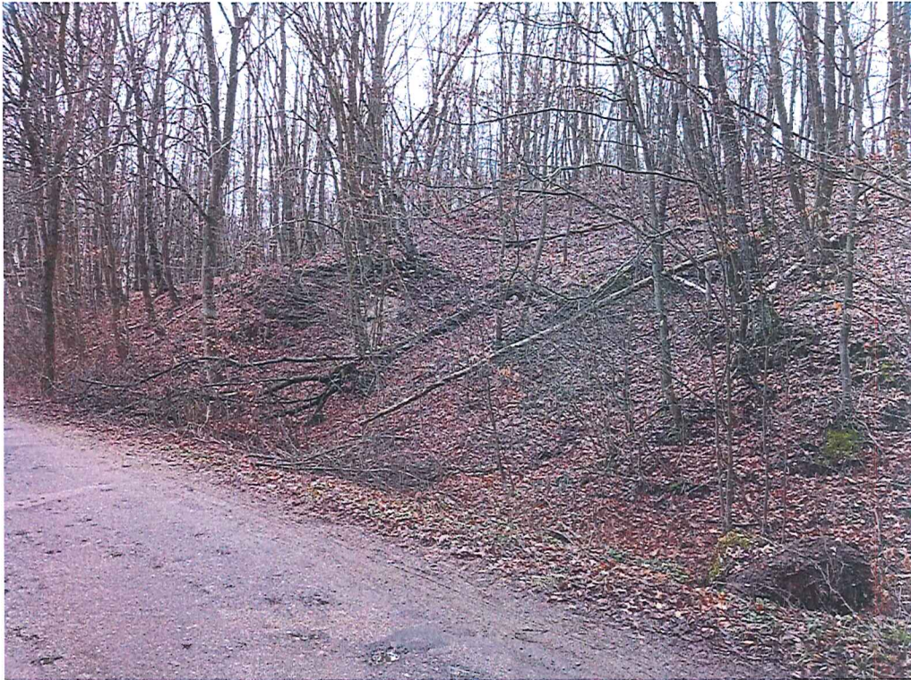
Fot. 4 Widok na wycinek terenu zagrożonego ruchami masowymi ziemi z drogi powiatowej nr 2102Z.