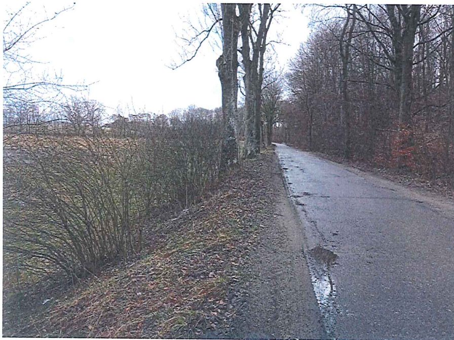
Fot. 7 Widok na wycinek terenu zagrożonego ruchami masowymi ziemi z drogi powiatowej nr 2102Z (po prawej stronie drogi); po lewej - łąki i pastwiska.