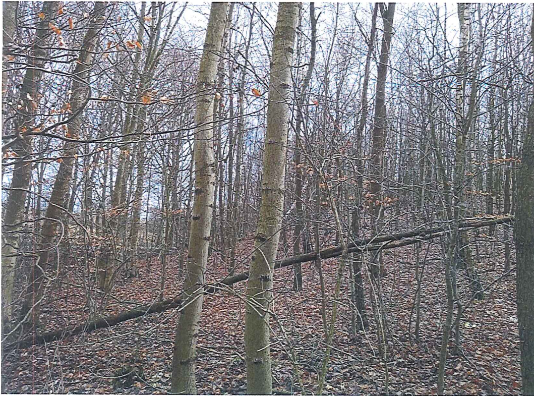
Fot. 2 Widok ogólny na wycinek terenu zagrożonego ruchami masowymi ziemi.