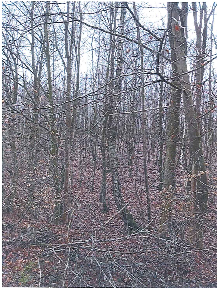
Fot. 3 Widok na wycinek terenu zagrożonego ruchami masowymi ziemi.