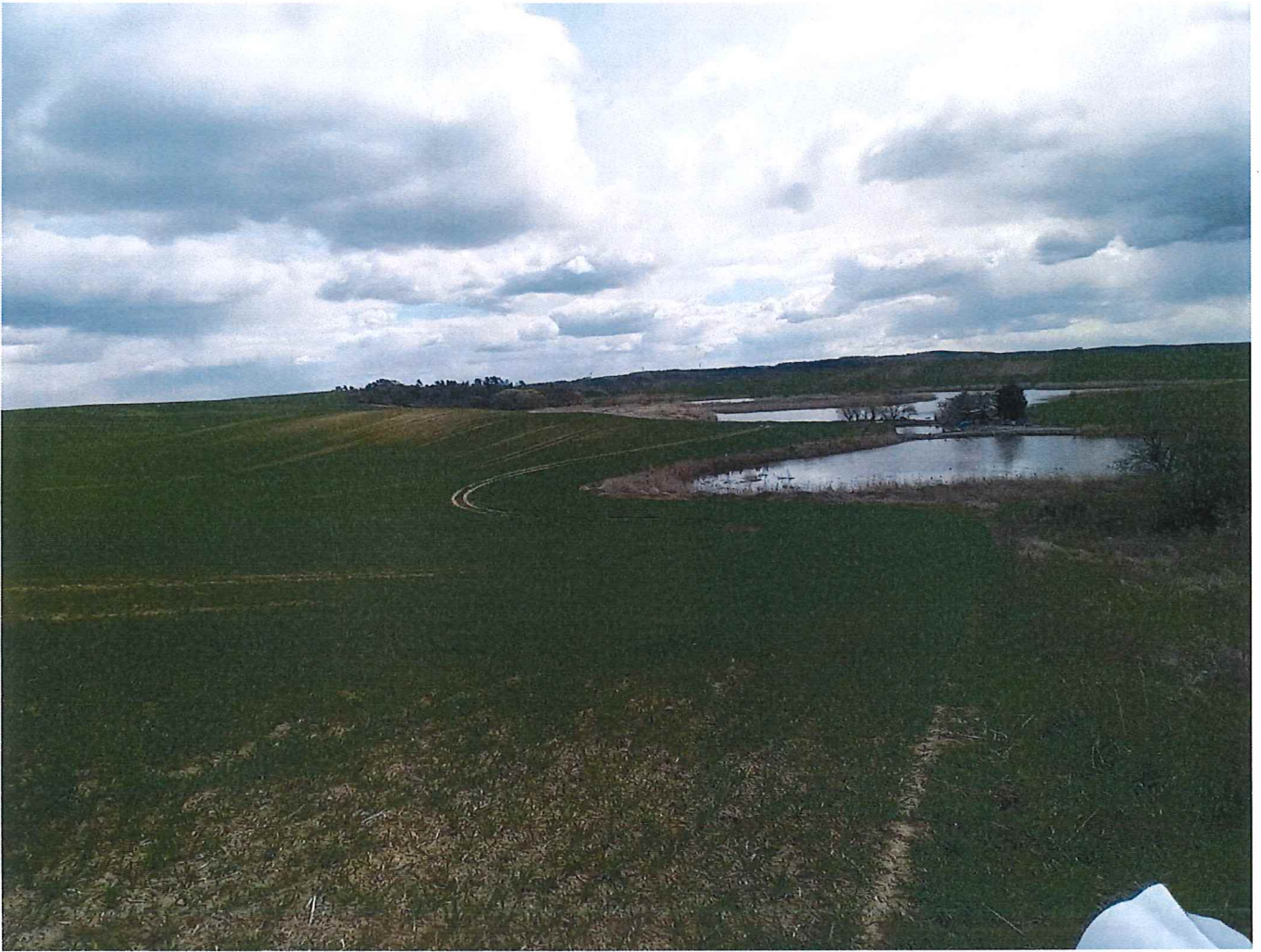
Fot. 2 Widok ogólny na wycinek terenu zagrożonego ruchami masowymi ziemi – u podnóża stawy rybne.