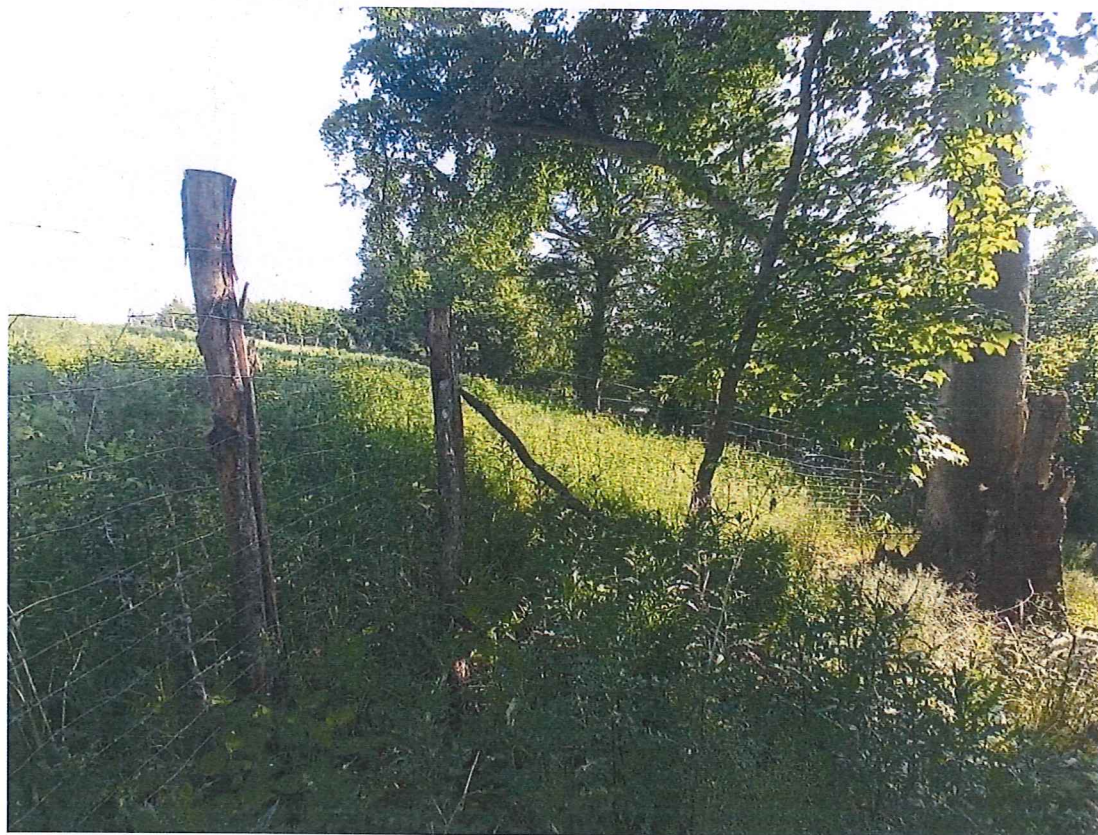
Fot. 7 Widok na wycinek terenu zagrożonego ze spadkiem w kierunku jeziora Dolskie.