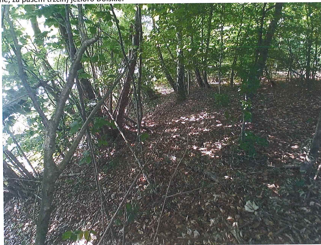
Fot. 5 Widok na teren zagrożony (część środkowo-wschodnia) w kierunku południowym – po lewej stronie zdjęcia (niewidoczne) jezioro Dolskie.