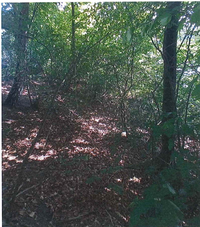
Fot. 4 Widok na teren zagrożony (część środkowo-wschodnia) w kierunku północnym – po prawej stronie zdjęcia (niewidoczne, za pasem trzciny) jezioro Dolskie.