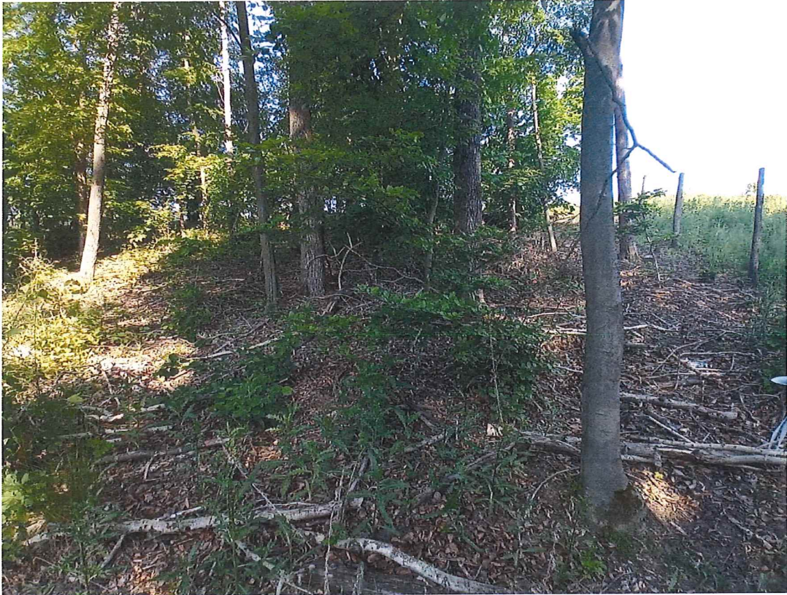
Fot. 8 Widok na wycinek terenu zagrożonego.