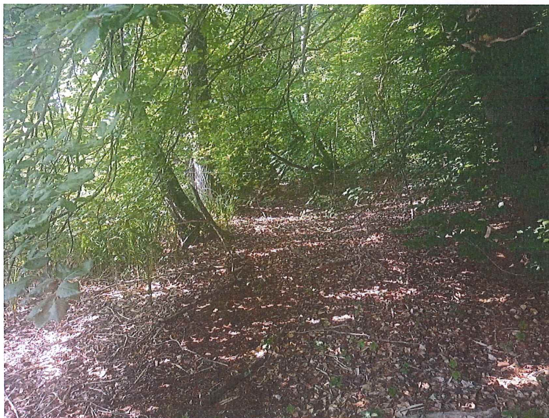
Fot. 3 Widok na teren zagrożony (część południowo-wschodnia) w kierunku południowym – po lewej stronie zdjęcia (niewidoczne, za pasem trzciny) jezioro Dolskie.