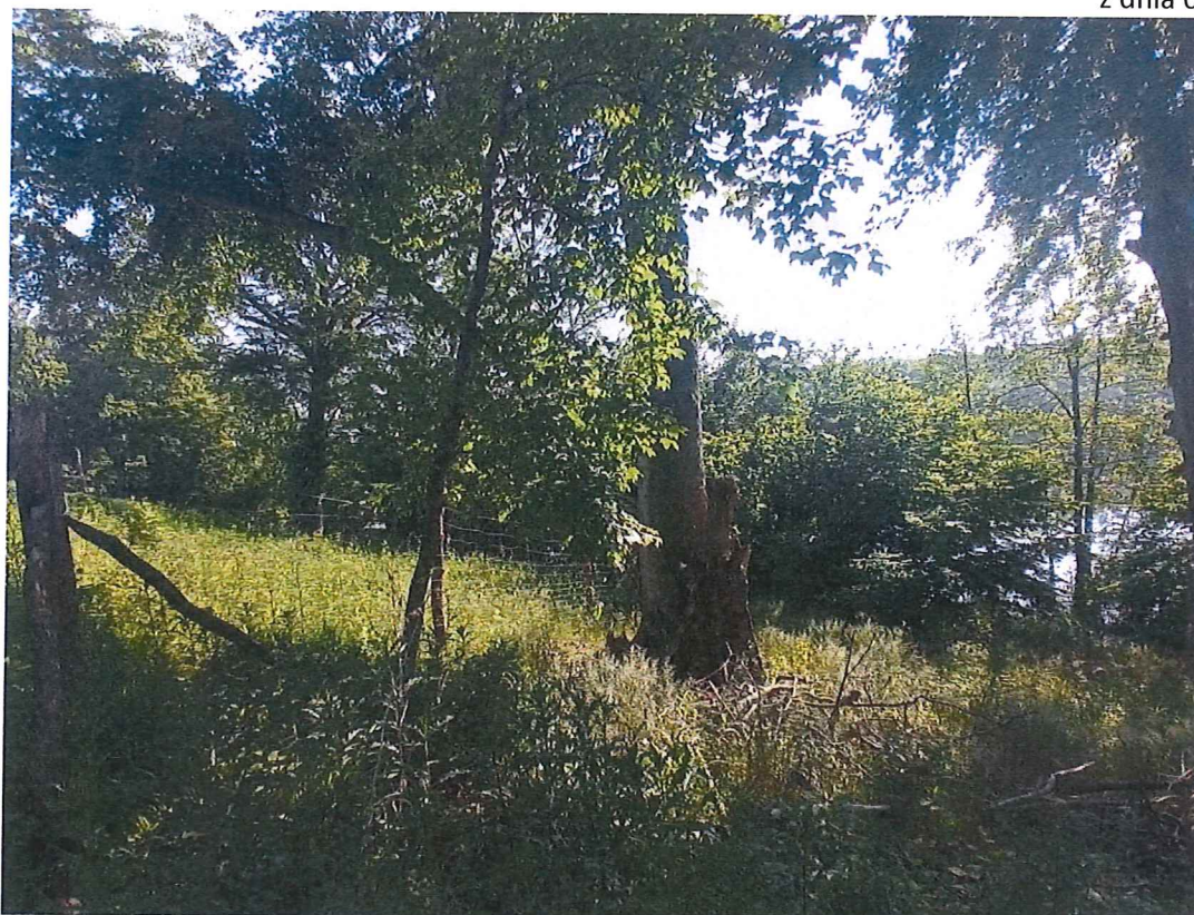
Fot. 6 Widok na wycinek terenu zagrożonego z wysokiego zbocza w kierunku jeziora Dolskie.