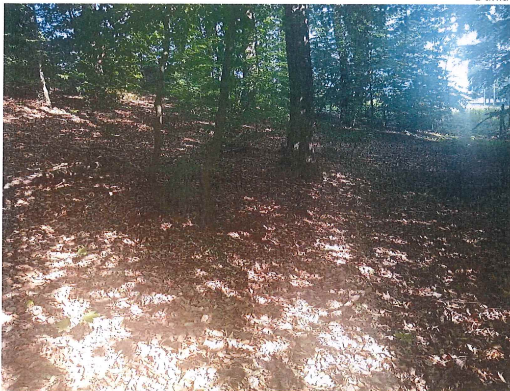
Fot. 2 Widok na teren zagrożony (część południowo-wschodnia) w kierunku zachodnim.