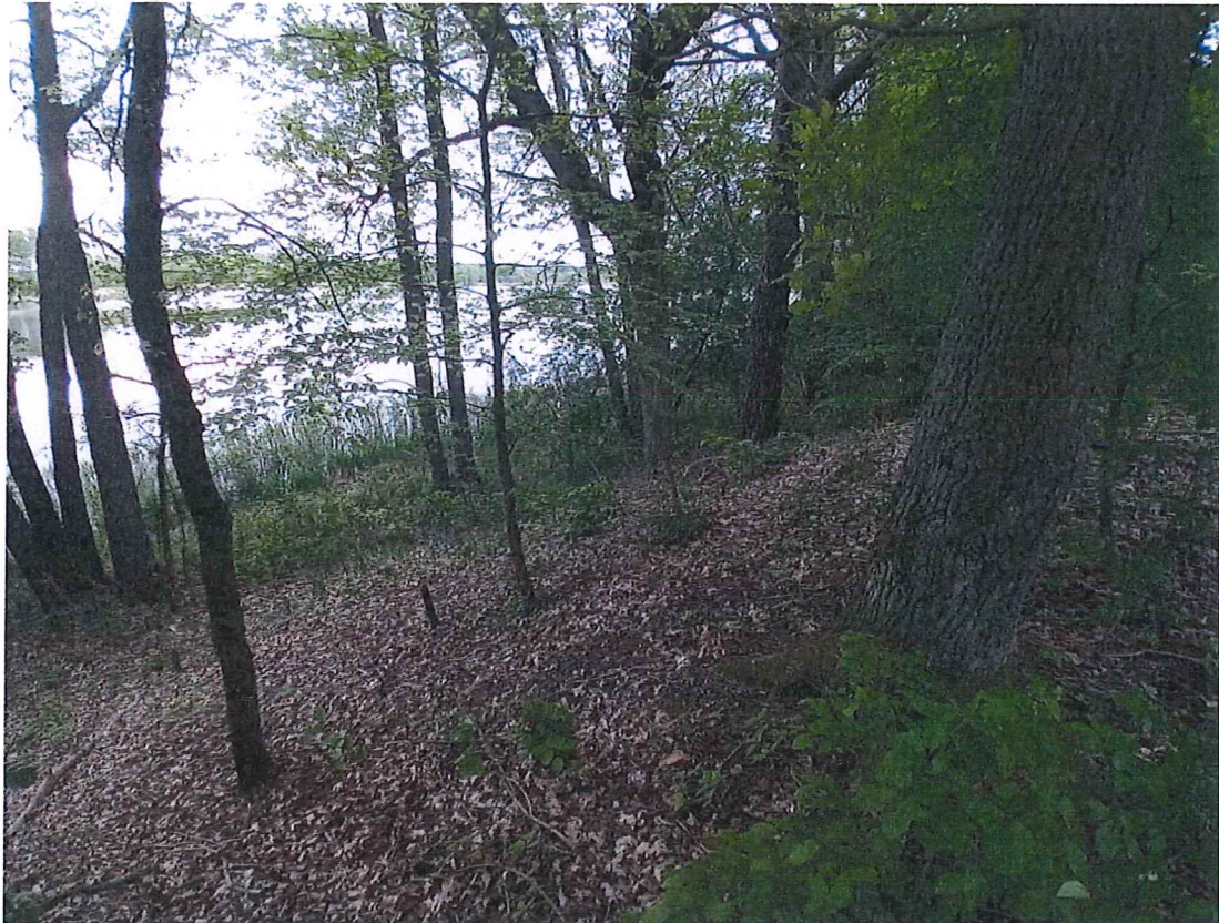
Fot. 3 Widok na teren zagrożony ruchami masowymi ziemi; widoczne jezioro Postne u podnóża zbocza.