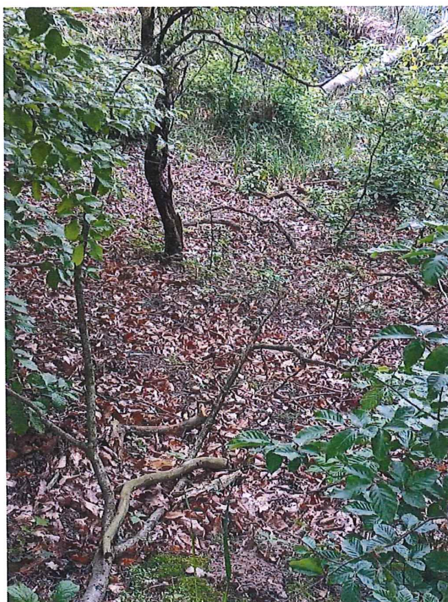
Fot. 6 Widok na teren zagrożony ruchami masowymi ziemi; nie stwierdzono „gołym okiem” ruchów masowych - drobne ślady spęływania po zboczu, nie stwierdzono obrywów.