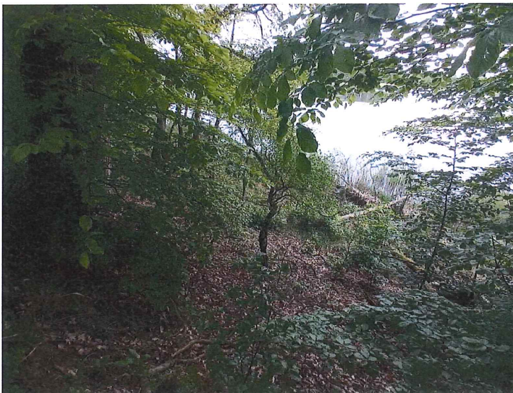
Fot. 5 Widok na teren zagrożony ruchami masowymi ziemi; nie stwierdzono „gołym okiem” ruchów masowych – drobne ślady spęływania po zboczu, nie stwierdzono obrywów.