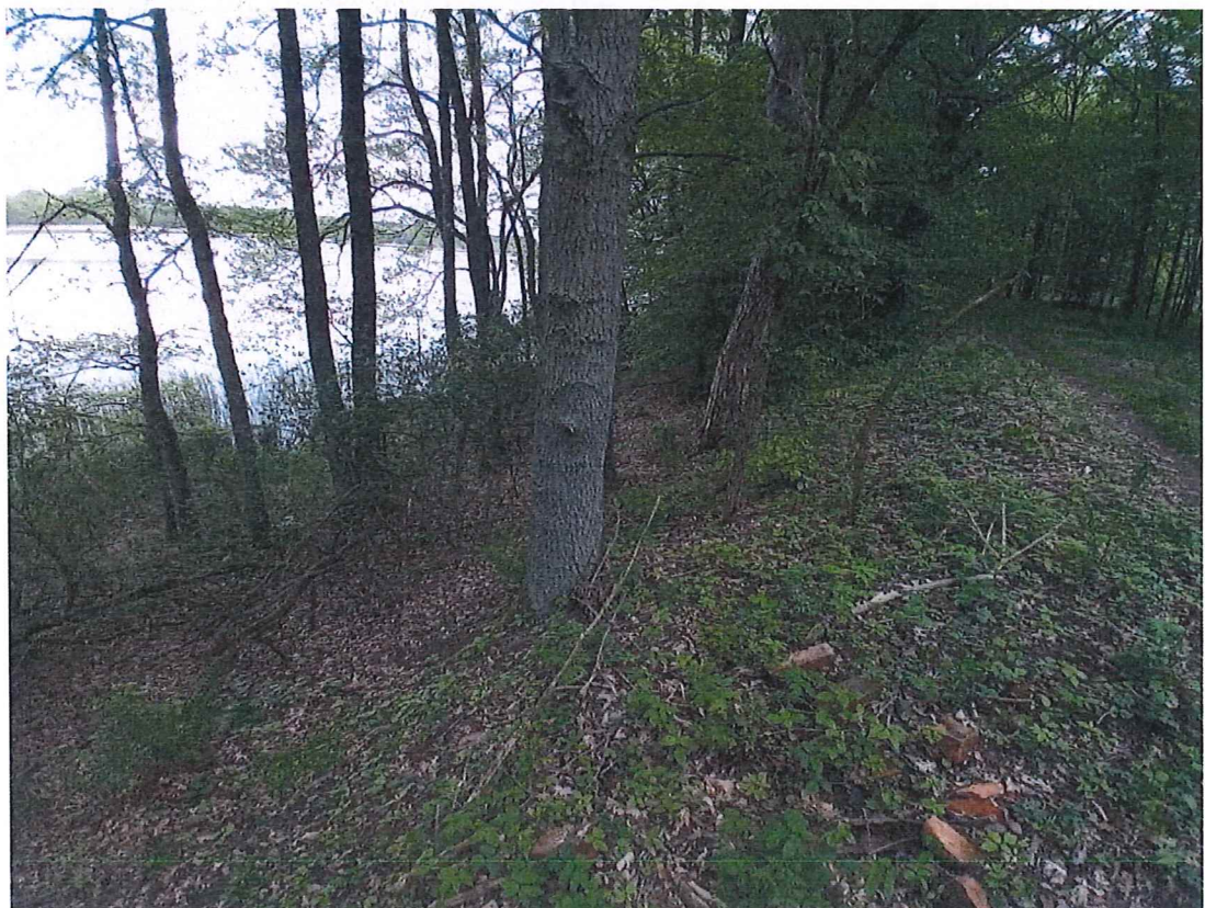
Fot. 4 Widok na teren zagrożony ruchami masowymi ziemi; po prawej widoczna droga leśna.