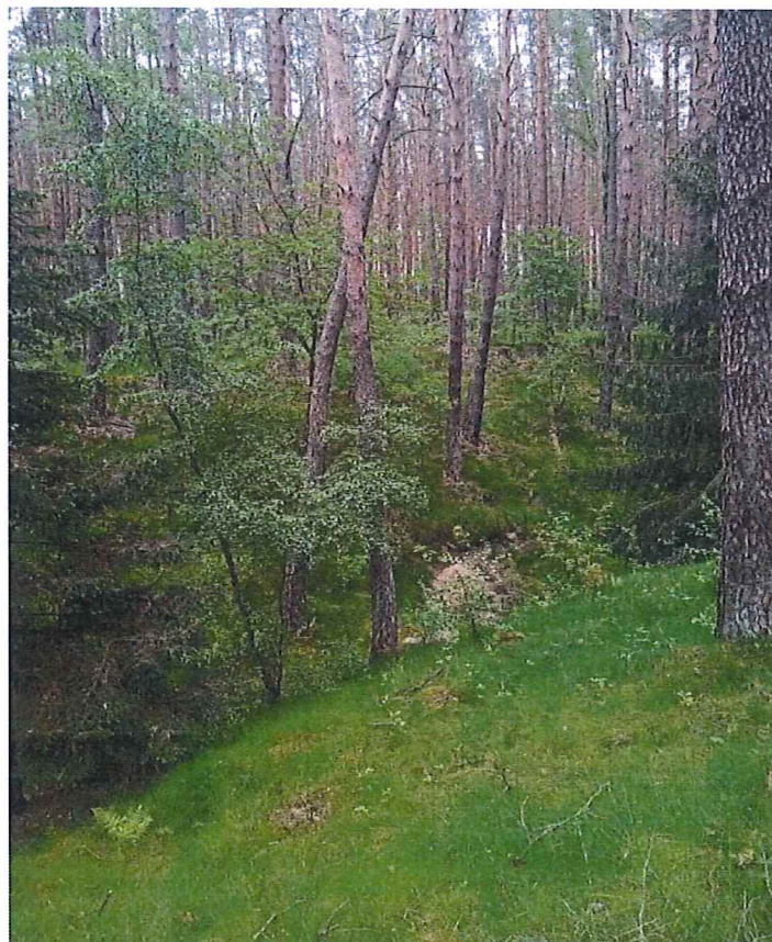
Fot. 5 Widok na teren zagrożony ruchami masowymi ziemi.