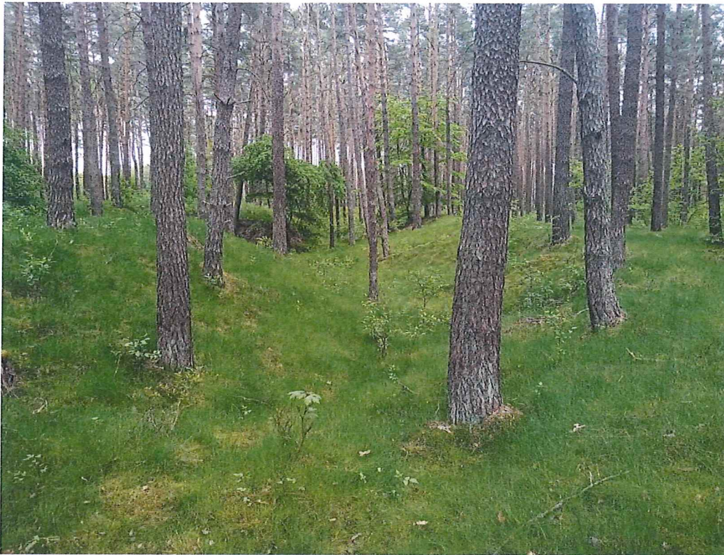
Fot. 2 Widok na teren zagrożony ruchami masowymi ziemi (strona prawa zdjęcia); widok na „wejście” do wąwozu od strony drogi Smolnica-Warnice.