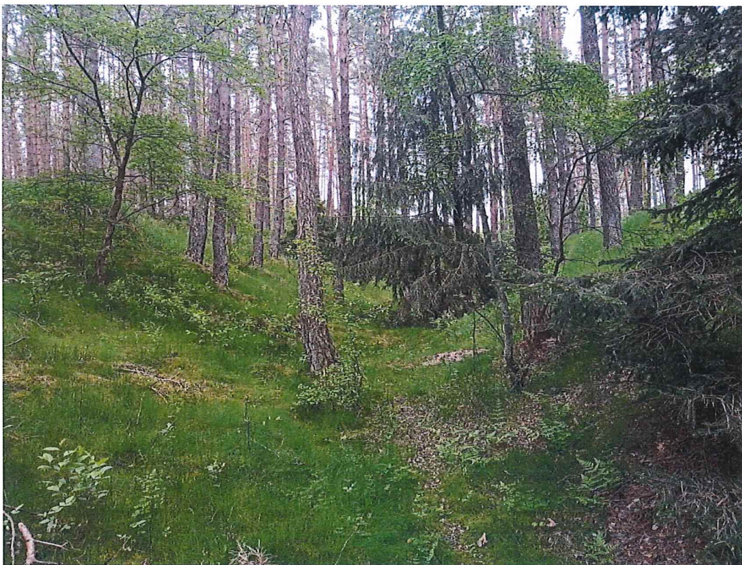
Fot. 3 Zbocze terenu zagrożonego ruchami masowymi ziemi.