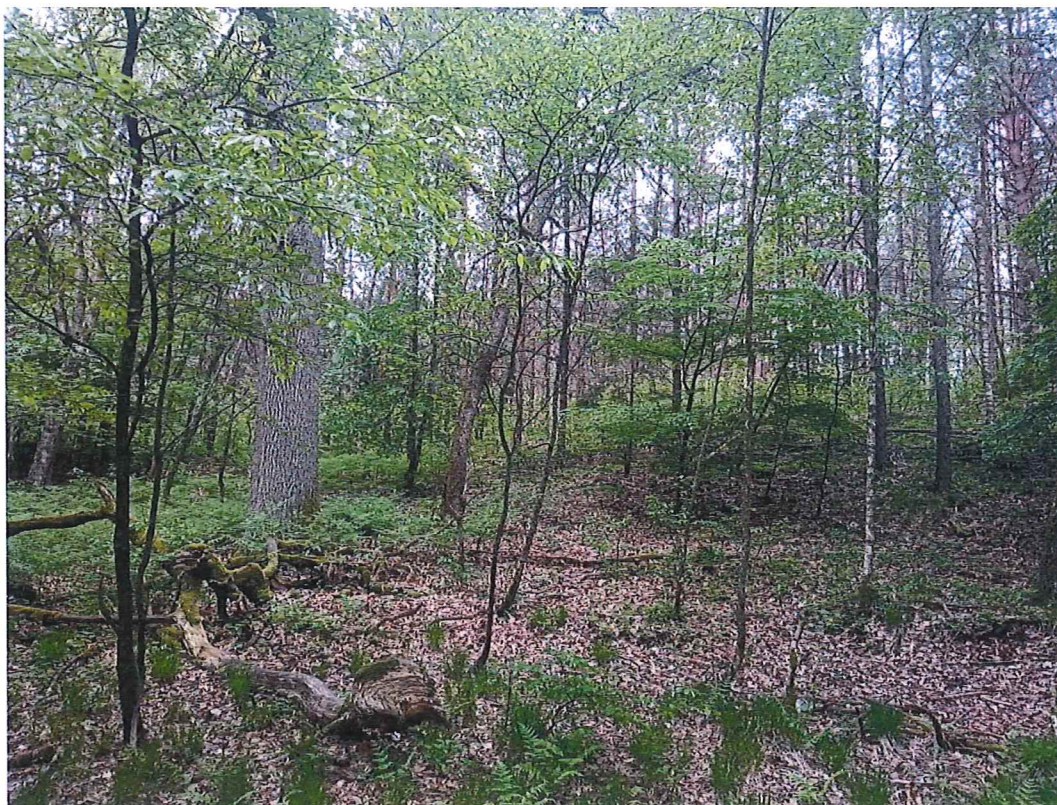
Fot. 6 Widok na teren zagrożony ruchami masowymi ziemi; nie stwierdzono podmokłości w dolnej części zbocza.