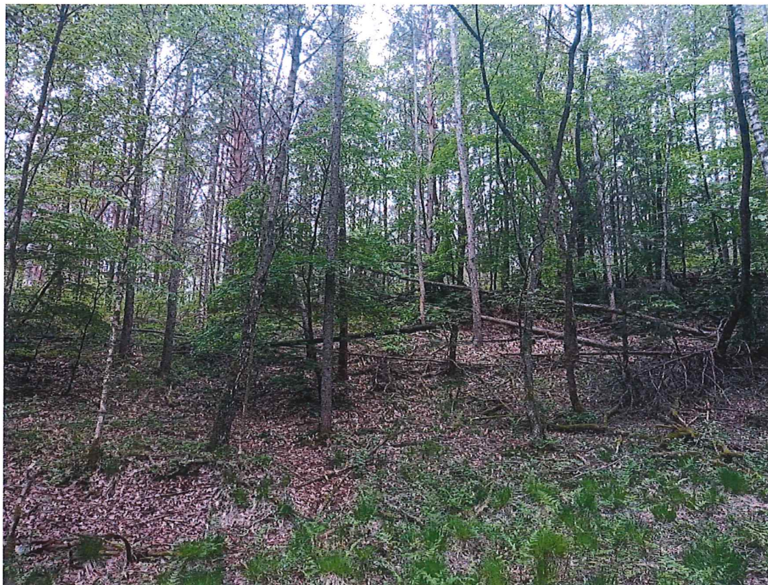
Fot. 5 Widok ogólny na teren zagrożony ruchami masowymi ziemi; nie stwierdzono „gołym okiem” ruchów masowych – drobne ślady spęływania po zboczu.