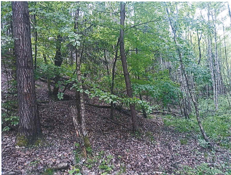
Fot. 4 Widok na teren zagrożony ruchami masowymi ziemi.