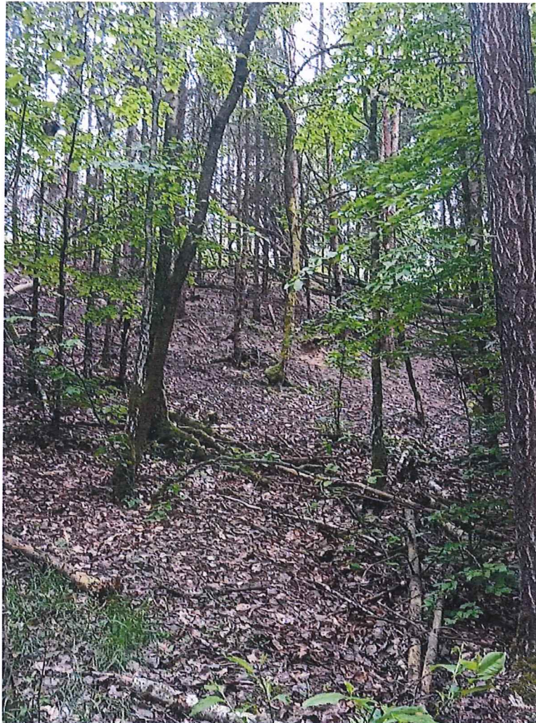
Fot. 3 Widok na teren zagrożony ruchami masowymi ziemi.