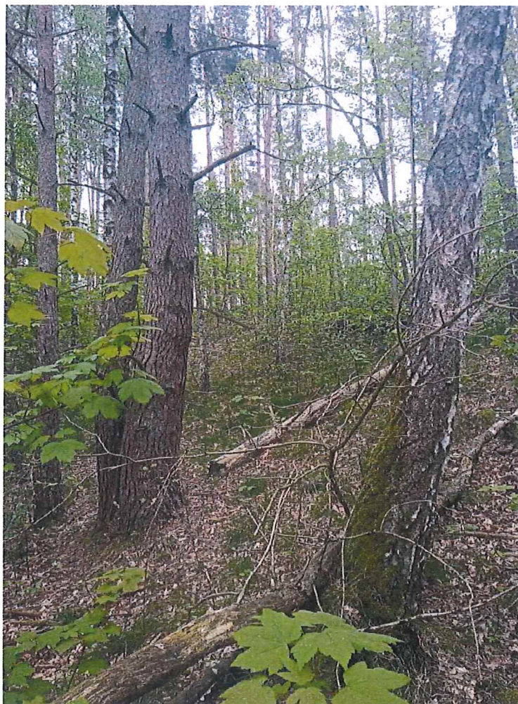
Fot. 2 Widok ogólny na teren zagrożony ruchami masowymi ziemi (część północno-zachodnia).