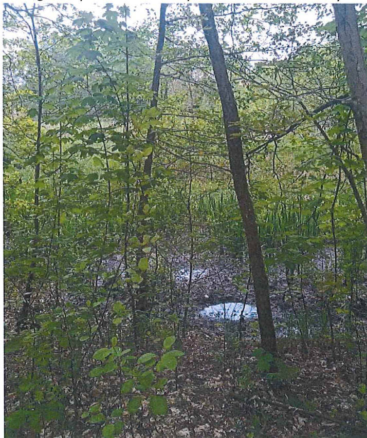
Fot. 4 Widok ogólny na teren zagrożony ruchami masowymi ziemi (część północno-wschodnia); w dolnej części zbocza starorzecze, okresowo wypełnione wodą, w dniu wizji teren podmokły, bagienny.