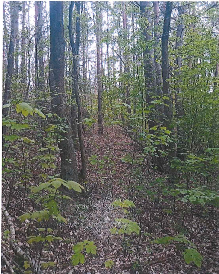
Fot. 3 Widok ogólny na teren zagrożony ruchami masowymi ziemi – drobne zsuwy.